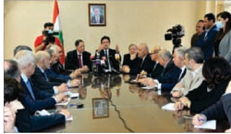
المكاري متحدًا خلال اللقاء مع المسؤولين الصحفيين والإعلاميين أمس.

جاءه لإقراره بنسخته المعدلة قبل الانتخابات النيابية»، مشيراً إلى أن هذا الأمر يشكل خطوة في مسار تعزيز دور الإعلام في لبنان وحماية الحريات العامة.» وجدد التأكيد أن «وزارة الإعلام هي لحماية الإعلاميين وليس للقمعهم.»