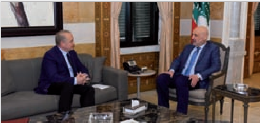
مولوي وروداكوف خلال لقائهما أمس

● كذلك استقبال السفير الكوبي في لبنان السيد Jerge Porfirio Leon Cruz، في زيارة تعارف لمناسبة توليه مهامه الجديدة في لبنان.