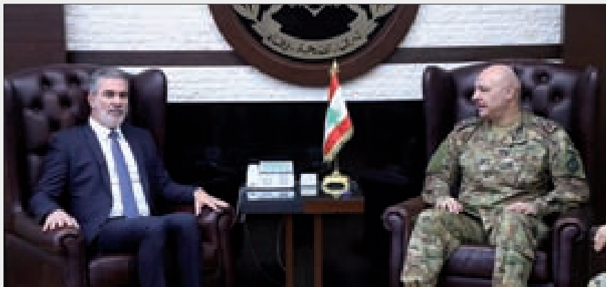
قائد الجيش خلال لقائه وزير السياحة في اليرزة أمس

سفيري باكستان سلمان آتار، وإسبانيا إيفناسيو سانتو، تمهيداً لتقديمها في وقت لاحق إلى رئيس الجمهورية العماد ميشال عون.