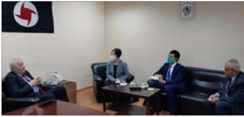
غصن مستقبلاً الوفد الدبلوماسي الصيني

السيد نصر الله متحدًا عبر الشاشة مساء أمس