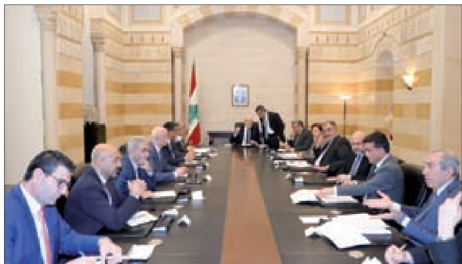
ميقاتي مترشاً اجتماع اللجنة الوزارية المكلفة معالجة تداعيات الأزمة المالية (اللاتي ونهرا)

اقتراحات ستعرض على مجلس الوزراء لدرسها وإقرارها. واجتمع الحكومة مع وزير الخارجية والمغتربين عبدالله بو حبيب.