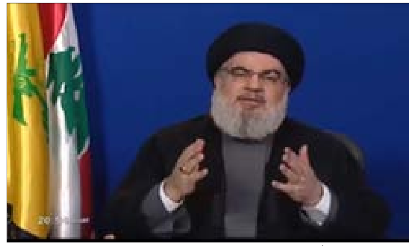
السيد نصر الله متحدًا عبر الشاشة مساء أمس