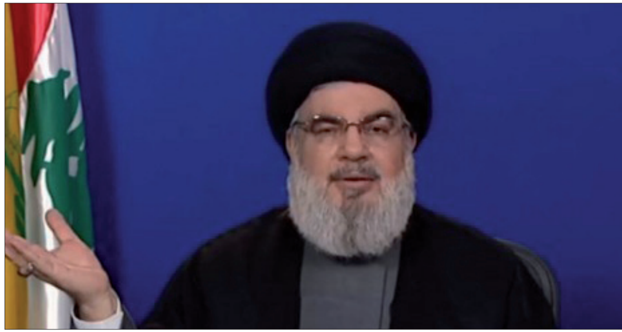
السيد نصرالله متحدثاً عبر شاشة المنار مساء أمس