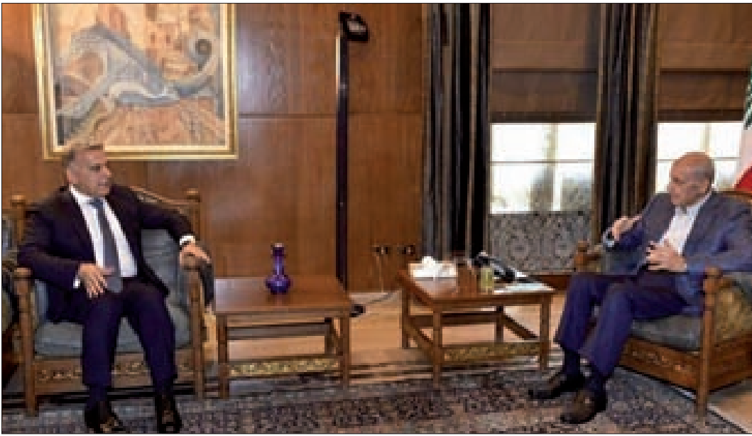
بري مستقبلاً إبراهيم في عين التينة أمس

عرض رئيس مجلس النواب نبيه بري في مقرّ الرئاسة الثانية في عين التينة مع نائب رئيس المجلس الإسلامي الشيعي الأعلى الشيخ علي الخطيب، الأوضاع العامة وآخر المستجدات. واستقبل الرئيس بري المدير العام للأمن العام اللواء عباس إبراهيم الذي وضع رئيس المجلس في أجواء ونتائج زيارته إلى الولايات المتحدة الأميركية. كما جرى البحث في الأوضاع العامة لا سيما الأمنية.