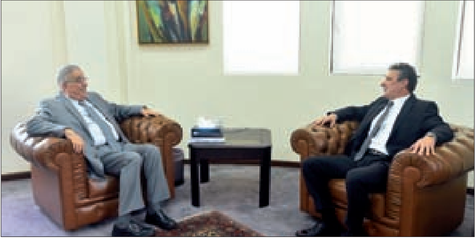
بو حبيب خلال لقاءه سفير قبرص أمس

استقبل وزير الخارجية والمغتربين في حكومة تصريف الأعمال الدكتور عبد الله بو حبيب، سفير قبرص بانايوتيس كيرياكو للاستيضاح حول التمارين العسكرية المشتركة مع إسرائيل، معترضاً على ما ورد في الإعلام الإسرائيلي» على أنها موجهة ضد لبنان».