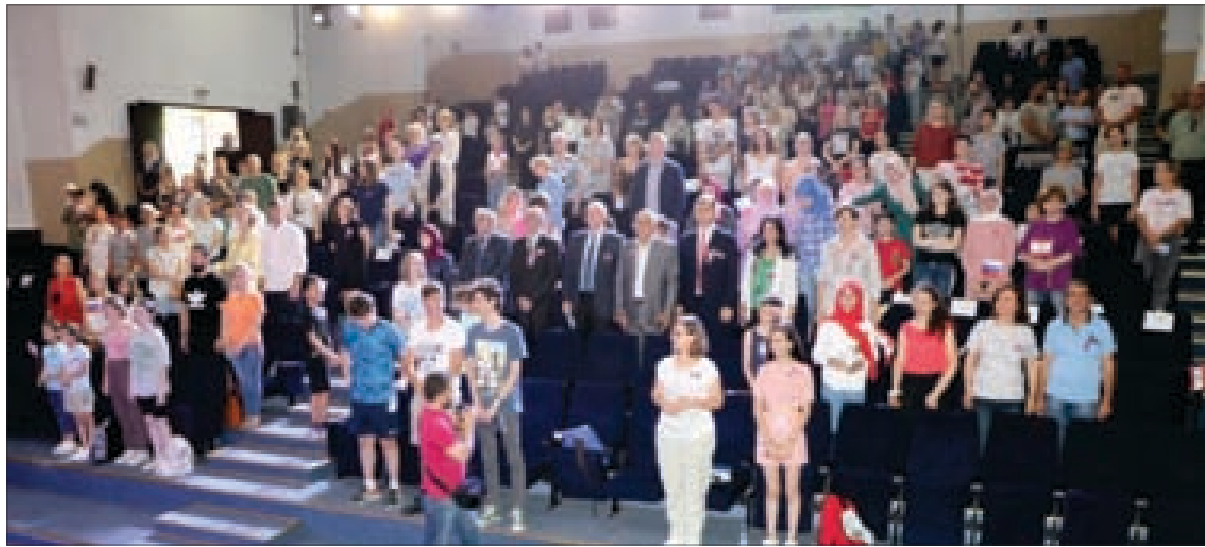
جانب من الحضور في المهرجان التراثي