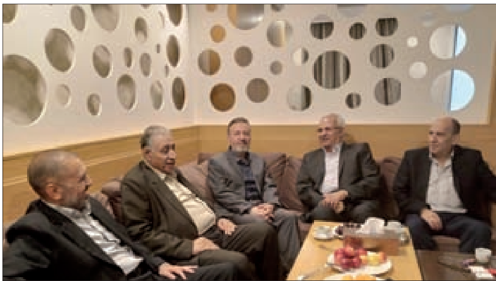
خلال اللقاء بين الوفد القومي وقيادة القيادة العامة

مميّزة على الصمود الاستثنائي الذي يمارسونه في مواجهة السجان الصهيوني، فيحققون كل يوم انتصاراً جديداً.