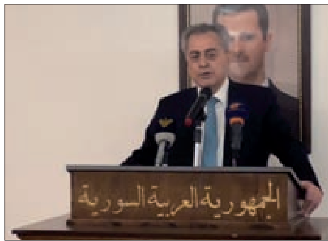
سفير سورية يلقي كلمته

بين البلدين إذ أنّ العلاقات الإيرانية السورية شهدت تطوراً مستمراً خلال أربع عقود ونيف بعد الثورة الإسلامية في إيران، هذه الروابط الأخوية تقدّمت في كافة المجالات ولعبت دوراً حاسماً في التصدي للمؤامرات والتهديدات