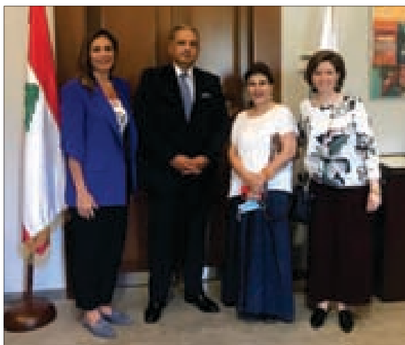
...ومع وفد لجنة قصر المير أمين