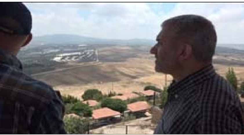
بيرم خلال جولته الجنوبية

ووجه «رسالة إلى المطاحن بأنّه لا أعداد ولا صحة للكلام بأن لاعتمادات مفتوحة، فالاعتمادات ما زالت مفتوحة وهي ستمدّد وبالتالي يجب إكمال استيراد القمح من دون أي انقطاع لنظّل المادة