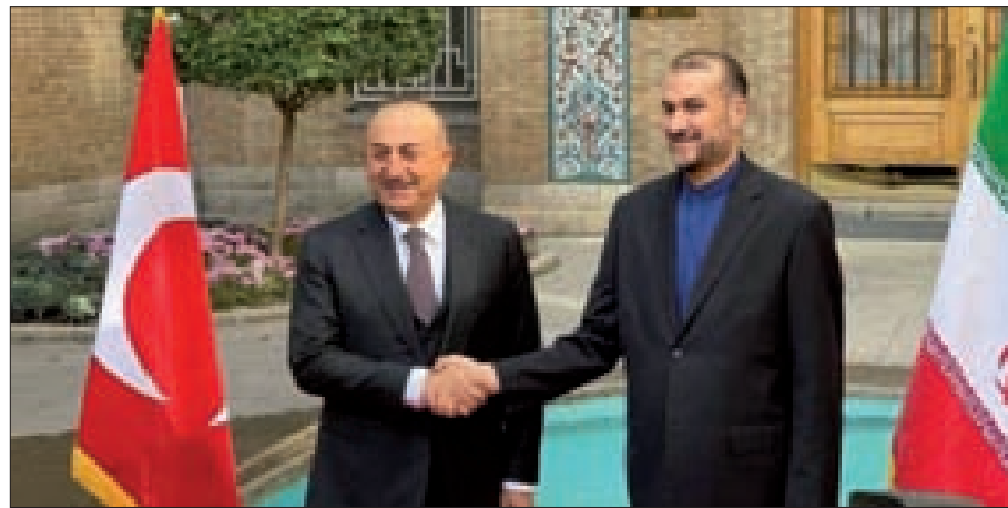
عبد الهيمان وجاويش أوغلو خلال لقاءهما في أنقرة

المنحازة إلى الكيان الصهيوني غير الشرعي»، مؤكدة «عمق العلاقات بين طهران وأنقرة، وضرورة تعزيز العلاقات والمشاورات بين المؤسسات السياسية والأمنية في البلدين».