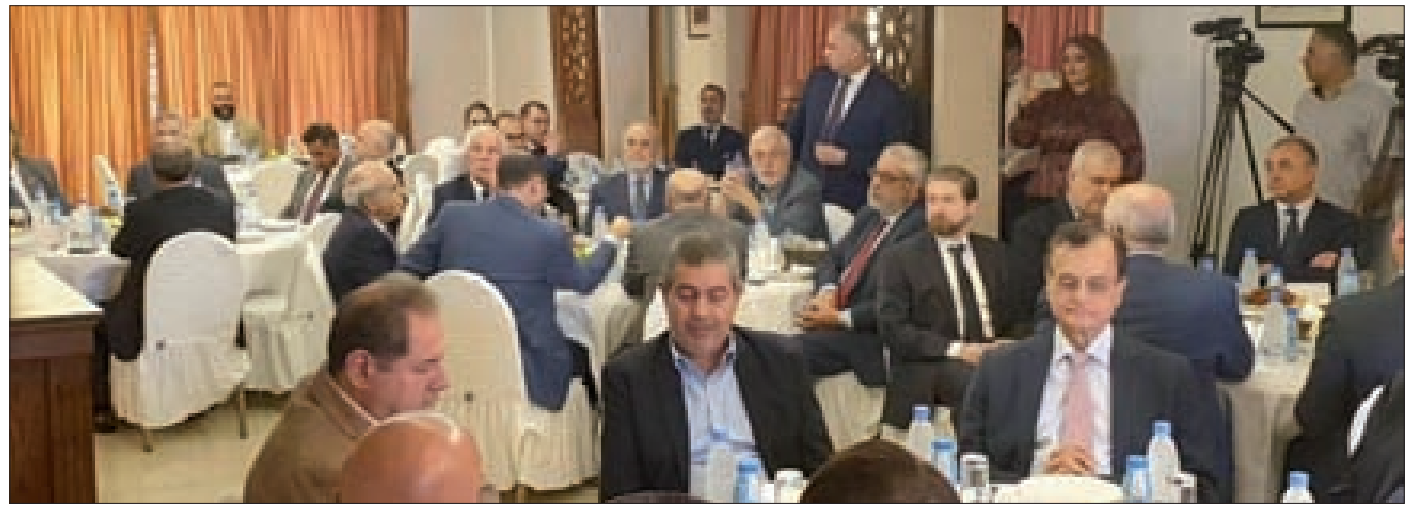
جانب من الحضور في مأدبة التكريم