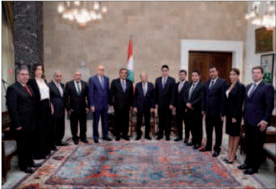
الرئيس عون متوسطاً للنقيب شرارة وأعضاء مجلس نقابة خبراء المحاسبة في بعثدا أمس

وكان النقيب شرارة قدّم للرئيس عون في مستهل اللقاء أعضاء المجلس الجديد لنقابة خبراء المحاسبة المجازين في لبنان بعد الانتخابات التي حصلت في 19 حزيران الماضي، لافتاً إلى أنّ النقابة تضمّ 2500 خبير محاسبي يتمتعون بكفاية عالية وخبرات تتولهم للقيام بمسؤولياتهم في التدقيق المالي وإعداد مشاريع القوانين المالية والاقتصادية والضريبية.