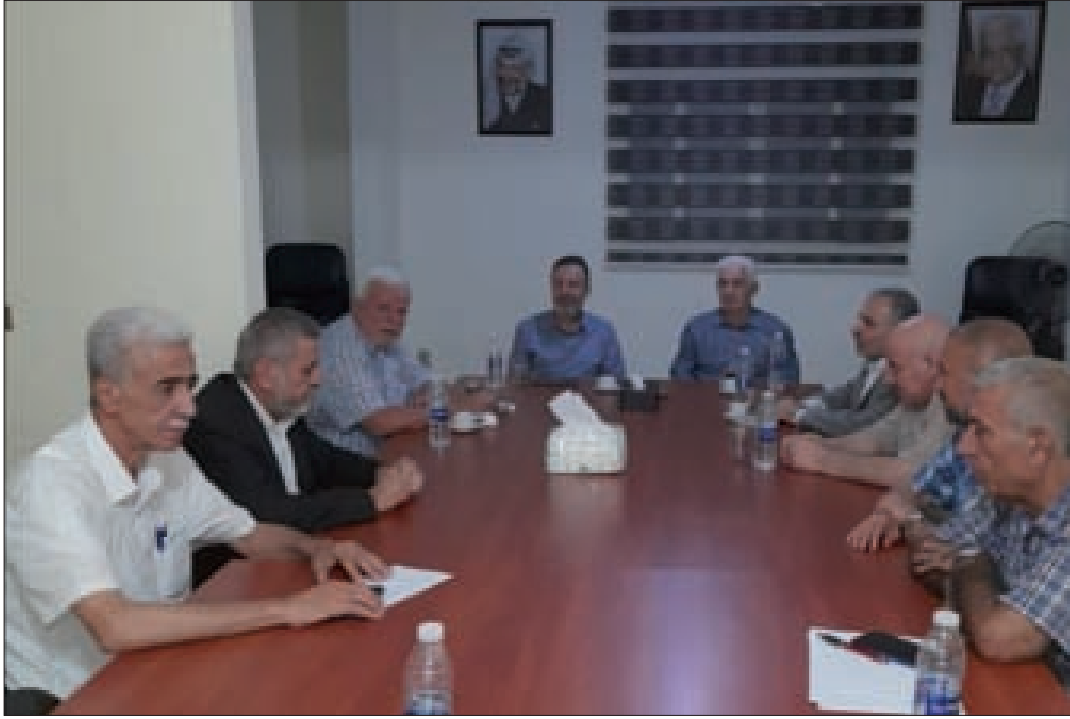
خلال اللقاء بين القومي وفتح

وجه المجتمعون التحية إلى أبناء شعبنا الفلسطيني المقاوم للصدام داخل فلسطين المحتلة، والذي يخوض حرب الوجود في مواجهة عصابات الإحتلال. وأكد المجتمعون على أنّ نهج المقاومة بكافة أشكالها هو السبيل الوحيد لتحرير فلسطين وكل أرضنا المحتلة. وشدّد المجتمعون على وجوب تأمين كافة الموارد اللازمة لوكالة الأورثو لتتمكن من القيام بواجباتها تجاه أهلنا لحين إنجاز حق العودة الذي لا يمكن أن يسقط بمرور الزمن. وتمسك المجتمعون بضرورة المحافظة على أمن وهدوء واستقرار مخيمات الصمود والعودة خاصة في ظل الأزمة الاقتصادية التي تعصف بلبنان. واتفق المجتمعون على استمرار اللقاءات والتنسيق لما فيه مصلحة أبناء شعبنا.