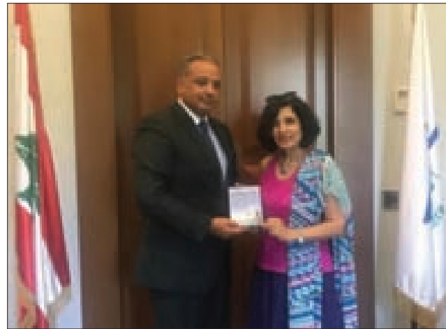
المرضى مستقبلا الكاتبة والمنتجة اللبنانية اليابانية

المرضى كتابها عن مسيرتها الثقافية ما بين اليابان ولبنان باللغة اليابانية على أن يترجم الى اللغة العربية وفق اقتراح الوزير المرضى.