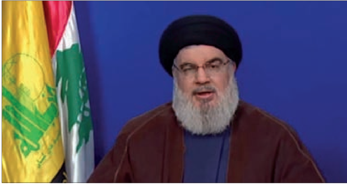
السيد نصرالله متحدّثاً عبر الشاشة مساء أمس

قبل أن تحسم الأمر، بين نيل الحقوق، وإلا فرض معادلة لا غاز ولا نفط من المنطقة. والقضية ليست كاريش مقابل قانا، ولا مسيرات غير مسلحة فوق المنصة، وسقف الأجل النهائي هو شهر أيلول، وفقاً لاستعادة منقحة لمعادلات حرب تموز 2006، كاريش وما بعد كاريش وما بعد كاريش، وإن أردتموها حرباً مفتوحة فلتكن حرباً مفتوحة. والحرب المفتوحة هي ما يشهده لبنان وما يمكن أن يشهده إذا بقي الخداع والتفاوضي بتسريب الأخبار المطمئنة حول قرب التوصل لاتفاق، كما في قضية استجرار الكهرباء الأردنية والغاز المصري عبر سورية التي تجرر أذيال الوعود المخادعة منذ سنة. القضية مع أميركا وليست مع سواها، وعلى أميركا تدبر أمرها قبل قوات الأوان، وفقاً لما أوضح السيد نصرالله أن المقاومة لا تخوض بصده حرباً نفسية، فهي تضع معادلاتها على أعلى درجة من الجدية، فليس أمام لبنان والبنانيين من فرص إنقاذية أمام حجم الحاجات التي يفرضها الانهيار الا ثرواته في النفط والغاز المخزون في بحره والمنوع عنه بقوة القرار الأميركي، والفرصة الإقناذية تلاقيها فرصة ذهبية تقدّمها هي حاجة أوروبا (النتمة ص5)