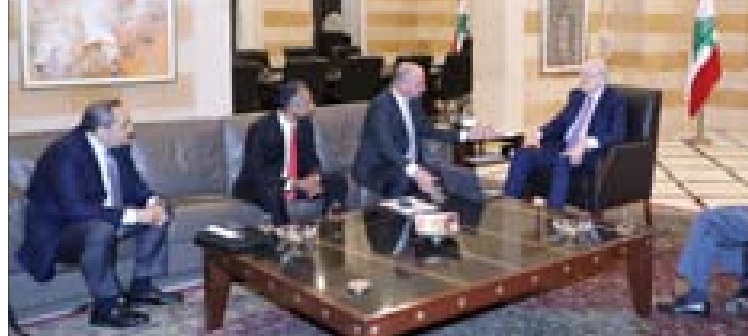
ميقاتي خلال لقاءه، وقد شركة سيمس الألمانية في السرايا أمس

اجتماعية في حكومة تصريف الأعمال مكتور حجار الذي قال «عرضت لدولة الرئيس مراحل تطبيق برنامج «أمان» والصعوبات التي نواجهها وتشاورنا في الحلول الممكنة لتفعيل هذا البرنامج ليصل إلى 150 ألف عائلة كما هو مقرّر، علماً بأن عدد المستفيدين حتى الآن بلغ 75 ألف عائلة». أضاف «كما عرضنا موضوع الجمعيات الإنسانية ووضعها الصعب وسنتابع الملف مع مصرف لبنان بالنسبة إلى مطالبهم. أيضاً عرضنا لدولة الرئيس أجواء زيارتنا لطرابلس واللقاءات التي أجريتها إضافة إلى الجهود التي تقوم بها جمعية «المنهج» وجمعية «أم النور» في مركز لمعالجة المدمنين على المخدرات. وأبدى الرئيس ميقاتي استعداده لدعم عمل المركز معنوياً ومادياً». واجتمع ميقاتي مع وزير الزراعة في حكومة تصريف الأعمال عباس حسن الذي قال إثر اللقاء «بحثنا في الهموم الزراعية تحديداً وعملياً الاستيراد والتصدير. وضعت دولة الرئيس في جو عمل عمليات التصدير الحاصلة وتخليص المعاملات التي تُحنّى بها وزارة الزراعة. وكان هناك حديث أيضاً عن موضوع الإضراب العام، وأكد دولة الرئيس أن هذا