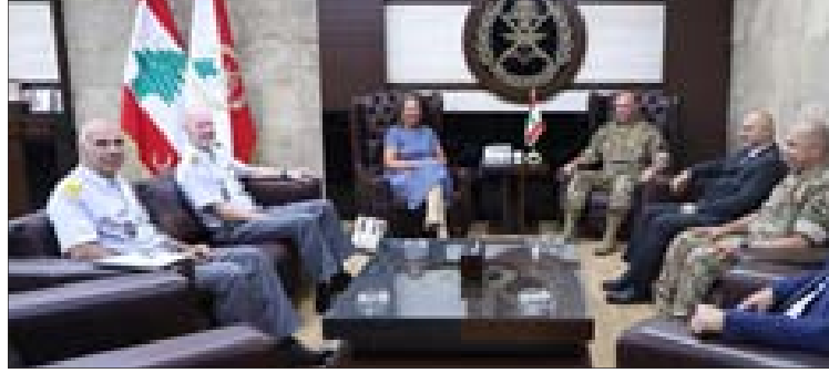
قائد الجيش خلال استقباله سفيرة سويسرا في البرزة أمس