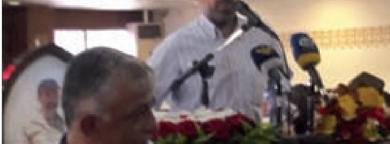
مهدي يلقي كلمة القومي

بعد ذلك انتقل أعضاء الحملة إلى مدافن شهداء فلسطين حيث شاركوا «جبهة النضال الشعبي الفلسطيني» احتفالها بالذكرى 55 لتأسيسها في القدس وعلى رأسها الراحل الشهيد الدكتور سمير غوشه،