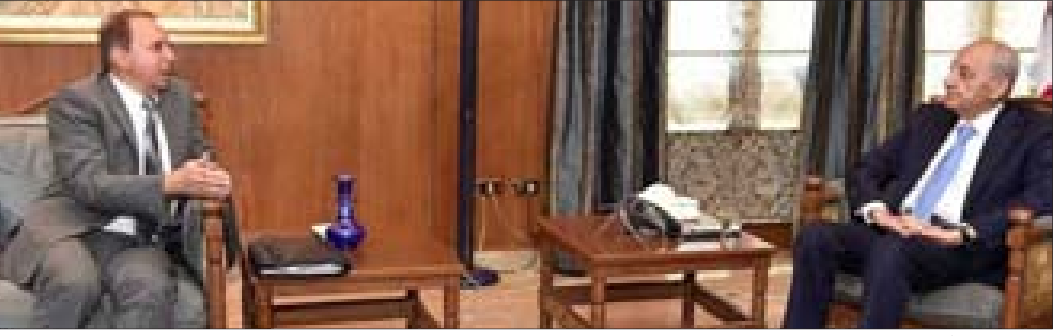
بري مستقبل شرف الدين في عين التينة أمس

1 في المائة على المبالغ التي تتعدى المليون دولار كإرسدة في البنوك فلا أحد من الأثرياء الوطنيين يُمكن أن يعترض على هذه الضريبة التي تجمع مبلغ 450 مليون من الفريش دولار وإذا توزّعت على 67 مصراً بمبلغ لكل بنك 5.8 مليون دولاراً. أضاف «تحدثنا أيضاً في ملف مهم إنسانياً وهو ملف النازحين السوريين والذي هو ملف حساس جداً، والجدير بالأمر، هناك التقاف وطني حول هذا الموضوع ووجدت تجاوباً كلياً وتفاعلاً من دولة الرئيس وهو متحمس وسعيت منه كلاماً وطنياً حول موضوع النازحين. نحن «مكملين» وقریباً سنكون في سورية لإكمال هذه المهمة». واستقبل الرئيس برّي رئيس «حزب الوطنيين الأحرار» النائب كميل شمعون مع وفد من المجلس السياسي في الحزب. وعرض معه الأوضاع العامة والمستجدات السياسية. كما التقى برّي النائب السابق سمير الجسر.