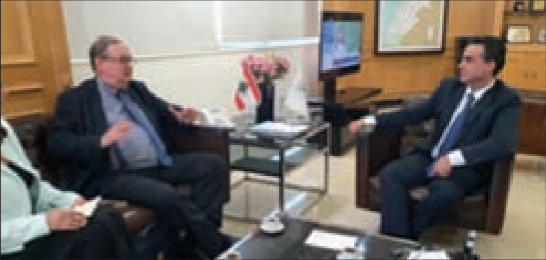
حمية مستقبلاً دوكان أمس

جال منسق المساعدات الدولية من أجل لبنان السفير بيار دوكان والوفد المرافق، على المسؤولين فاجتمع إلى وزير الأشغال العامّة والنقل في حكومة تصريف الأعمال على حمية وناقشا الأوضاع في لبنان عموماً والمواضيع التي تُعنى بها الوزارة، كالمرافق والنقل المشترك وسكك الحديد وإعادة إعمار مرفأ بيروت.