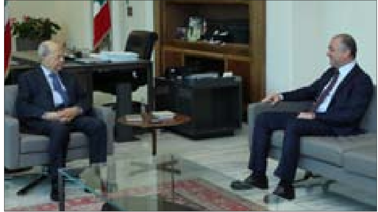
عون مجتمعاً إلى بو صعب في بعبدأ أمس

عن رئيس الجمهورية العماد ميشال عون أمس في قصر بعبدأ، مع نائب رئيس مجلس النواب إلياس بو صعب الأوضاع العامة في البلاد والتطورات الأخيرة، كما ركّز البحث على متابعة الملفات التي يتولى بوضعها، ومنها أسباب توقف التحقيقات في جريمة مرافق بيروت وعدد من المراسيم العالقة. واستقبل عون وزير الشباب والرياضة في حكومة تصريف الأعمال الدكتور جورج كلّاس الذي أوضح أنه قدّم لعون تقريراً