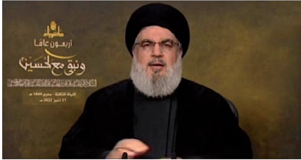
السيد نصرالله متحدثاً مساء أمس