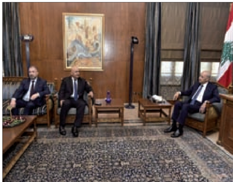
بري مجتمعاً إلى وفد البنك الدولي في عين التينة