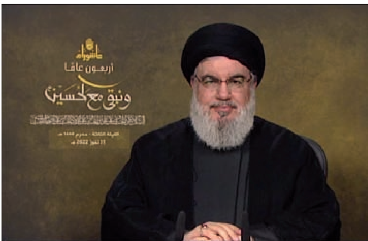
السيد نصرالله خلال إطلالته مساء أمس

المنصة وسفينتنا الإنتاج والحضر للعدو في مرمى الصواريخ