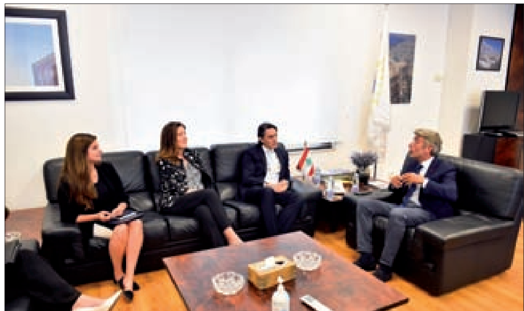
فياض مستقبلاً هوكشتاين وشيا أمس

وصل الوسيط الأميركي بشأن ترسيم الحدود البحرية الجنوبية أموس هوكشتاين إلى بيروت أمس، أتياً من طريق أثينا، للقاء المسؤولين ومتابعة المفاوضات معهم بشأن هذا الملف حيث ستكون له سلسلة لقاءات بدأها بقدمه إلى بيروت وبتابعها اليوم.