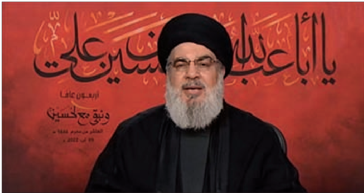
السيد نصرالله متحدثاً أمام مسيرة عاشوراء في الضاحية الجنوبية (النتمة ص4)

الحرب الإسرائيلية على غزة، وتصدّرت الأضواء مع النصر الذي فرضته المقاومة بإعادة تثبيت معادلة الردع بوجه جيش الاحتلال، رغم عامل المفاجأة بالاعتقالات التي استهدفت قادة سلاح الصواريخ في حركة الجهاد الإسلامي، ورغم ربط جيش الاحتلال لتحييد المنشآت المدنية والحكومية بتحديد حركة حماس عن المواجهة، وبقاء الجهاد وحدها في ميدان الرد على العدوان الإسرائيلي، وفوزها منفردة بفرض تثبيت معادلات الردع، فقد تصدر الأحداث استشهاد قائد كتائب شهداء الأقصى في نابلس إبراهيم النابلسي، ورسالته المؤثرة التي أعلن فيها عزمه على الاستشهاد بعدما قامت قوات الاحتلال بتطويق مكان وجوده ومحاصرته، وجاء موقف والد الشهيد النابلسي يشعل مشاعر الفلسطينيين برابطة جأشها وموقفها الداعم للمقاومة، ليتقدّم شعار وقف التنسيق الأمني بين السلطة الفلسطينية وجيش الاحتلال مطالبات المشييعين، وهو ما أكدته القيادات الفلسطينية الوطنية، باعتباره الرد الوحيد على حملات التنكيل والحصار والاعتقال والمداومة التي تشهدها الضفة الغربية، تحت مظلة تعاون أجهزة الأمن الفلسطينية مع مخابرات جيش الاحتلال.