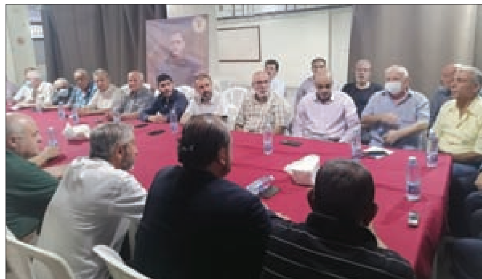
جاناب من الحضور

التحية العظمى لمن أزدت أن ترفأ ابنها عريساً، فتبدلت الأدوار ليزفها الإبن أمه شهيدة ماجدة من ماجدات فلسطين.