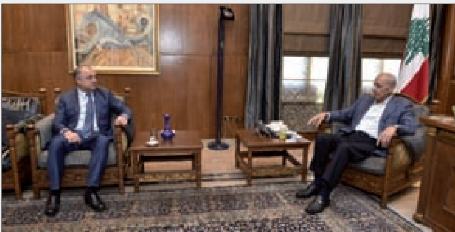
بري مستقبلاً بو صعب في عين الثينة أمس

استقبل قائد الجيش العماد جوزاف عون، في مكتبه في البرزة، النواب: النواب: ميشال معوض، جهاد بقرادوني، عدنان طرابلسي وطه ناجي على رأس وفد