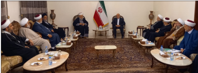
... ومجتمعاً إلى وفد تجمع العلماء المسلمين

وتوقع الأسعد «صعوبات كثيرة سيشهدها لبنان في الشهرين المقبلين لكثرة الاستحقاقات الداخلية والخارجية وانتظار تبلور المشهدين الإقليمي والدولي».