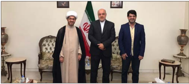
أمني خلال لقائه النابلسي أمس

يستقبل وزير العمل في حكومة تصريف الأعمال مصطفى بيرم، عند الساعة الواحدة والنصف من بعد ظهر اليوم الجمعة، السفير الإيراني في لبنان مجتبي أماني، في مكتبه في وزارة العمل - المشرفية - الطابق السادس.