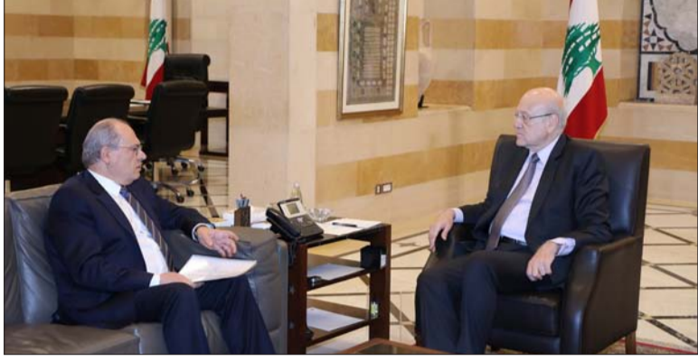
ميقاتي مستقبلاً الشامي في السرايا أمس

عقد رئيس حكومة تصريف الأعمال نجيب ميقاتي سلسلة اجتماعات وزارية في السرايا الحكومية، فاجتمع مع وزير الاتصالات جوني قرم الذي أوضح إثر اللقاء أن البحث تناول أوضاع قطاع الاتصالات، معلناً أنه كانت هناك اقتراحات عدّة لميقاتي سيتم درساها مع الموظفين قبل الإعلان عنها. ورداً على سؤال عما أثير حول اجتماعه مع الموظفين أول من أمس، قال «كان الاجتماع ودياً جداً، وأنفهم مشاكل الموظفين وأحاول حلها بالطرق القانونية المتاحة وفقاً للأموال التي لدينا، ولدي بعض الأفكار وسأطرحها عليهم، ومن الممكن أن أعقد اجتماعاً معهم بعد الظهر لإيجاد الحلول المناسبة في أسرع وقت ممكن». واجتمع ميقاتي مع نائب رئيس مجلس الوزراء سعادة الشامي، ثم مع وزير السياحة وليد نصار واستقبل الرئيس ميقاتي النائب أحمد الخير الذي قال إثر اللقاء «بحثنا مع الرئيس ميقاتي عدداً من الملفات السياسية والإنمائية (...) وتطرقنا إلى ملف الكهرباء، وجرى البحث في هذا الموضوع الذي يؤرق اللبنانيين جميعاً، تم التواصل مع وزير الطاقة وليد فياض الذي أكد لدولة الرئيس ميقاتي أن الكميات المطلوبة لتشغيل المعامل من الفيول العراقي لن تصل قبل 15