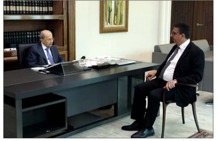
عون مجتمعاً إلى الحجار في بعداً أمس

عرض رئيس الجمهورية العماد ميشال عون مع وزير الشؤون الاجتماعية هكتور حجار، أمس في قصر بعبدا، عدداً من المواضيع المتعلقة بالوزارة إضافة إلى التطورات المتعلقة بملف النازحين السوريين والاتصالات التي تجريها الوزارة مع الجهات المعنية في هذا الملف. كذلك تطرق البحث إلى موضوع المساعدات التي تُوزَع على العائلات الأكثر فقراً من خلال البرنامج المُعد لهذه الغاية. وفي قصر بعبدا، سفير لبنان لدى ليبيريا ومالي هنري قسطن الذي أطلع رئيس الجمهورية على أوضاع الجاليات في كل من ليبيريا ومالي، والعلاقات بين لبنان وهاتين الدولتين لا سيما أنّ للجاليات دوراً في الحياة الاقتصادية والتجارية في كل من البلدين. من جهة أخرى، أبرق عون إلى الرئيس الروسي فلاديمير بوتين معزياً بوفاة رئيس الاتحاد السوفياتي السابق ميخائيل غورباتشوف.