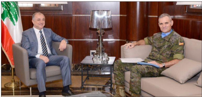
بو صعب و لزارو خلال لقائهما في المجلس النيابي أمس

استقبل نائب رئيس مجلس النواب إلياس بو صعب في مكتبه في المجلس أمس، رئيس بعثة «يونيفيل» وقائدها العام اللواء أولدو لزارو، يرافقه نائبه جاك كريستوفيدس والوفد المرافق وعرض معهم لأخبر المستجدات والتطورات الإقليمية خصوصاً في ملف ترسيم الحدود البحرية، بحسب بيان لمكتب بو صعب. كما تم التطرق إلى الصعوبات التي تواجهها «يونيفيل» على الحدود البرية والخط الأزرق. وأثنى بو صعب على «العمل الذي تقوم به يونيفيل منذ عشرات السنين». كما زار لزارو رئيس لجنة الدفاع والداخلية والبلديات النائب جهاد الصمد الذي أعلن بعد اللقاء أنه هنأ لزارو «بتجديد الولاية، وأكدنا ضرورة الاستمرار في ترسيخ الأمن والاستقرار في الجنوب مع تأكيدنا حقناً طالما أن لبنان كان دائماً في موقع الدفاع عن حقوقه، وأكدنا أنه طالما هناك احتلال وحقوق مغتصبة سيكون هناك