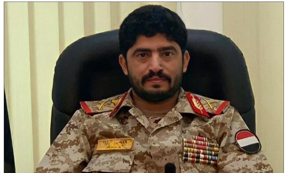
اللواء يحيى الرزامي