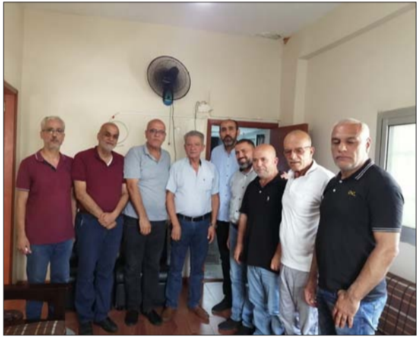
الأسرى في معركتهم ضد السجان الظالم.