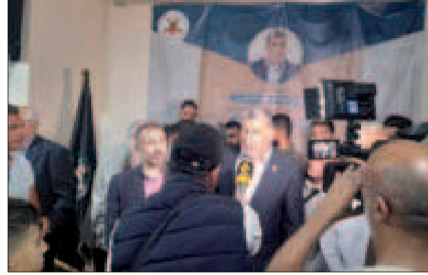
خلال اللقاء في مخيم برج البراجنة

معتبراً أنّ «اغتيال قيادات المقاومة لا ينهاها بل يزيد قوتها وتمتدّد فحركات المقاومة هي حركات ولادة».