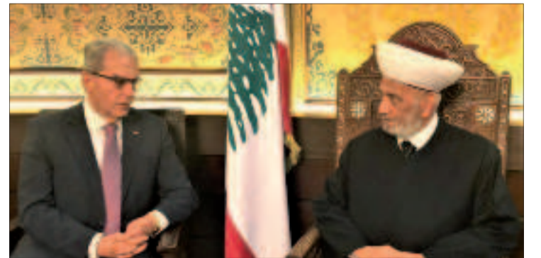
دريان مستقبلاً الخازن أسمر

استقبل مفتي الجمهورية الشيخ عبد اللطيف دريان في دار الفتوى، عميد «المجلس العام الماروني» الوزير السابق وديع الخازن الذي قال بعد اللقاء «تداولنا الأوضاع على الصعيد الوطني وكيفية السعي لإبعاد التجاذبات عن الساحة الداخلية. واعتبر المفتي أنّ الوحدة الوطنية هي أمضى سلاح لحماية السلم الأهلي»، مؤكداً أنّ «تعزيز أواصر الوحدة يكون بتطبيق ما تبقى من بنود وردت في اتفاق الطائف والحوار الدائم والبناء ونبيذ كل ما يفرق بين اللبنانيين، فضلاً عن التشديد على الاستقرار الأمني والسياسي والاجتماعي».