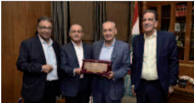
.. ومع وفد الجبهة الشعبية لتحرير فلسطين