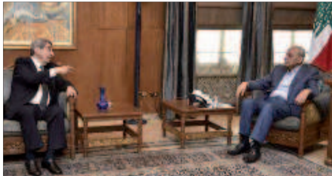
بري مستقبلاً الفرزلي في عين التينة أمس

عرض رئيس مجلس النواب نبيه بري في عين التينة، مع وفد من الجبهة الشعبية لتحرير فلسطين برئاسة نائب الأمين للجبهة جميل مزهر في حضور مسؤول الملف الفلسطيني في حركة أمل عضو المكتب السياسي في الحركة محمد الجياوي، تطورات الأوضاع داخل الأراضي الفلسطينية المحتلة على ضوء تصاعد العدوانية «الإسرائيلية» في حق المقدسات الإسلامية والمسيحية في القدس والمسجد الأقصى.