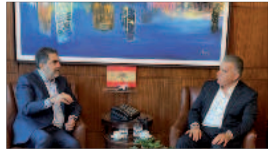
إبراهيم والساحلي خلال لقائهما أمس

التقى المدير العام للأمن العام اللواء عباس إبراهيم، رئيس حكومة تصريف الأعمال نجيب ميقاتي، أمس في السرايا الحكومية.