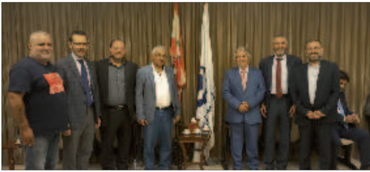
مهدي مع البدوي وعدد من المهنيين

لمقاومة النائب محمدرعد، النواب: ألان عون، أيوب حميد، د. فادي علامة، أسامة سعد وأمين شري. أمين سر حركة فتح وفصائل منظمة التحرير الفلسطينية في لبنان اللواء فتحي أبو العدرات وشخصيات حزبية ودينية ونقابية واجتماعية وإعلامية. ورحب البدوي بالمهنيين وشكرهم، وأشار إلى «خطة ندوة العمل الوطني المستقبلية».