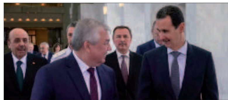
الرئيس الأسد مرحباً بالموفد الروسي في دمشق (سانا)

استقبل الرئيس السوري بشار الأسد، أمس، وفداً روسيا برئاسة المبعوث الخاص لرئيس روسيا الاتحادية الكسندر لافرتيف، حيث تمت مناقشة نتائج الاجتماع الخامس السوري - الروسي المشترك لمتابعة المؤتمر الدولي حول عودة اللاجئين والمهجرين السوريين. وأكد الرئيس الأسد، خلال الاجتماع، على أهمية آليات متابعة مخرجات الاجتماع الخامس السوري - الروسي المشترك، مشيراً إلى «أهمية العمل المشترك في الجوانب الثقافية والتعليمية». وأوضح الأسد أن «ظروف الحرب المشتركة على الإرهاب سيساعد على الاندماج بين الشعبين الروسي والسوري من الناحيتين الثقافية والاجتماعية».