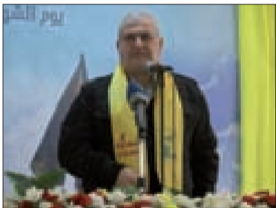
رعد متحدّثاً في بلدة مجدل زون الجنوبية

إلى أن «من يُتابع أخبار لبنان في الخارج يلحظ كميةً تفاقُل أكبر بمستقبل البلد من الذي يُتابعها في الداخل. فبعد اتفاق الترسيم، انتقل لبنان من مكان إلى مكان آخر، ووفق المعلومات الموجودة فإن موضوع انتخاب رئيس جمهورية سيكون قريباً، متمنياً «أن تأتي فترة الأعياد في ظل وجود رئيس جمهورية يحمي الجميع وقريب من الجميع وحاضراً لكل اللبنانيين».