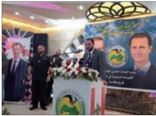
حجازي متحدثاً في احتفال عكار

كانت ثاراً مما أرساد الرئيس حافظ الأسد ووقف أميناً عليه، وحاملاً المشعل ذاته ومنتكبا الحمل ذاته والرسالة الرئيس الدكتور بشار الأسد".