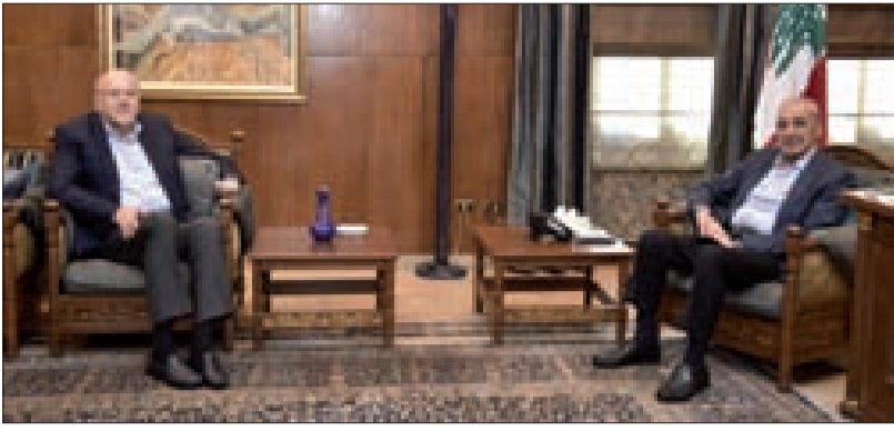
بري ومقاتي خلال لقائهما في عين التينة

المقاء غادر مقاتي عين التينة، من دون الإدلاء بتصريح مكتفياً بالقول رداً على سؤال عما إذا كان قد تناول في لقائه مع الرئيس بري موضوع ملف الكهرباء "اتفقنا على صيغة". كما استقبل الرئيس بري المحامي جوزف أبو فاضل ثم رئيس اللجنة المكلفة بإدارة الجالية اللبنانية في ساحل الحاج محمد قعفراني .