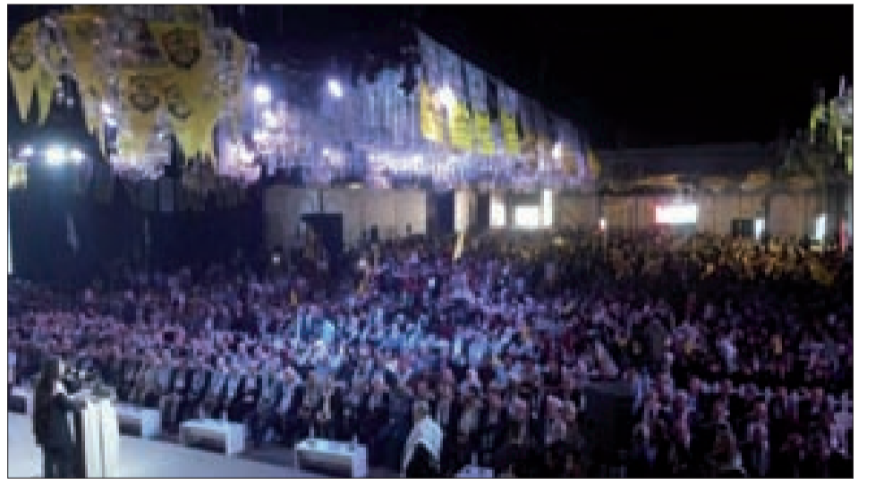
من الاحتفال في بيروت