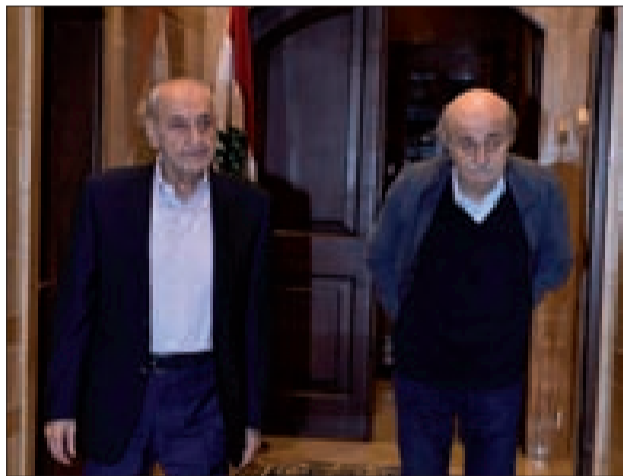
بري وجنبلاط في عين التينة أمس