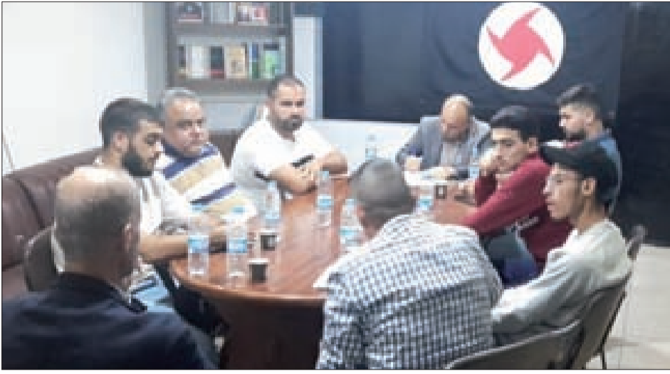
من الاجتماع في مكتب تنفيذية صيدا