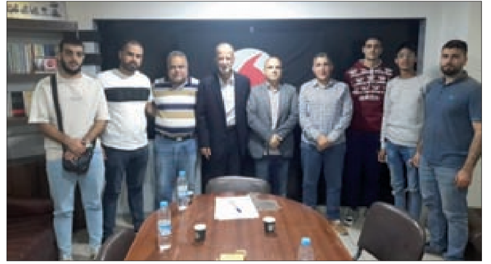
وفد المنظمات الشبابية في مكتب تنفيذية صيدا