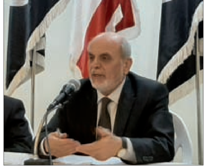
حردان متحدثاً في الاجتماع

تطوير النظام السياسي في لبنان لا يتحقق إلا بتطبيق المندرجات الإصلاحية في اتفاق الطائف بدءاً بإلغاء الطائفية وقانون للانتخابات النيابية خارج أي قيد طائفي وقانون جديد للأحوال الشخصية