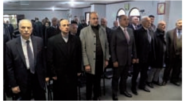
جانب من الحضور في الاحتفال في بعلبك