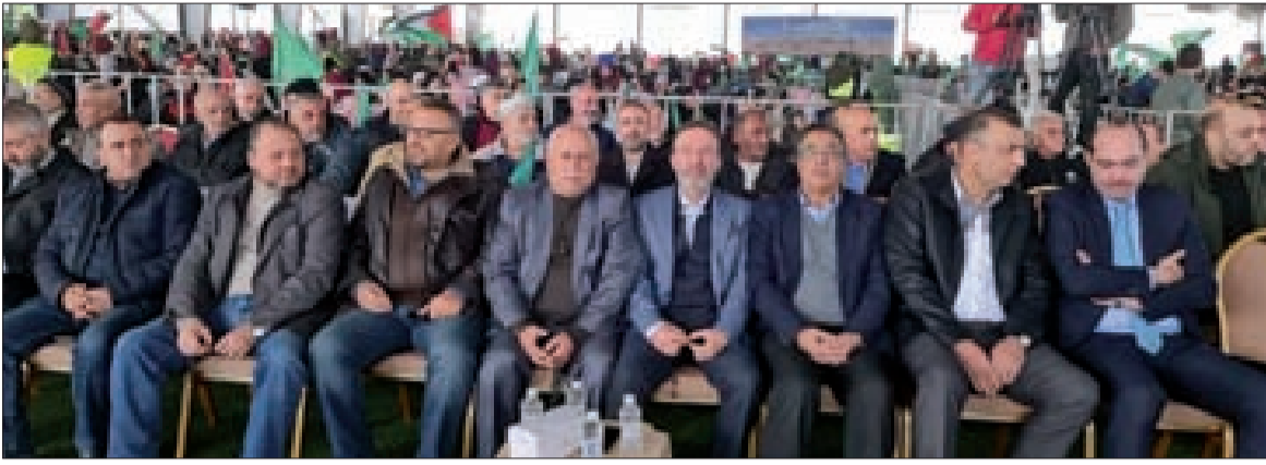
مقدم الحضور في مهرجان صيدا