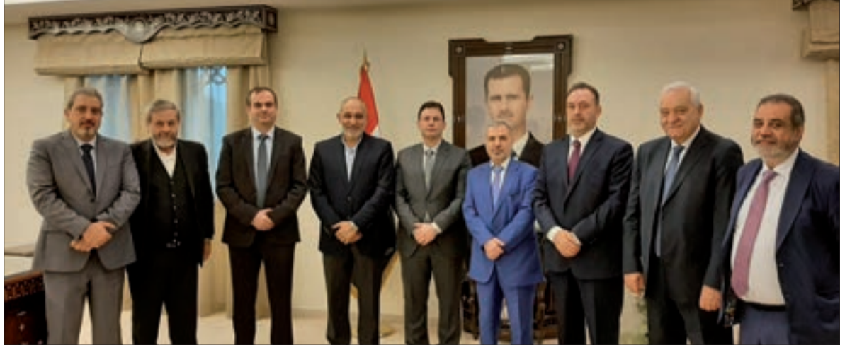
الوفد القومي مع دغمان وضاهر

أن سورية بقيادة السيد الرئيس بشار الأسد، ثابتة على مواقفها وخياراتها، ومهما اشتدت الضغوط عليها، لن تتخلى عن مسؤولياتها تجاه القضايا العادلة وفي طليعتها القضية الفلسطينية، ولن تنأى بنفسها عن احتضان ودعم المقاومة في مواجهة الاحتلال، ولن تتراجع عن التزاماتها تجاه الدول الشقيقة، لا سيما لبنان الذي قدمت التضحيات الجسام لتحقيق سلمه الأهلي وإعادة بناء مؤسسات دولته.