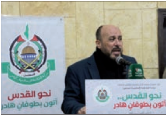
وعبد الهادي متحدتاً بإسم حماس