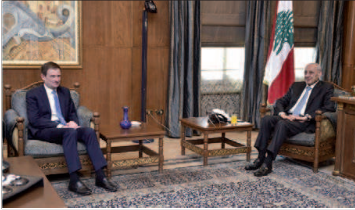
بري مستقلاً هيل في عين التينة أمس

في لبنان بقيت العلاقة بين حزب الله والتيار الوطني الحر فوق الطاولة، مع بيان توضيحي لحزب الله وردّ مباشر للتيار، ما أوحى بأن الأمور تحتاج الى المزيد من الوقت والصيانة قبل أن تعود الى نصابها، ما لم تأخذها السجلات وبعض الحسابات الخاطئة الى مكان آخر.