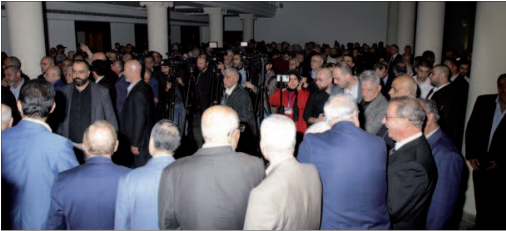
من حفل الاستقبال المركزي

رئيس المجلس الأعلى الأمين سمير رفعت: حزبنا يزداد شباباً وتلقاً وعطاءً، وصبراً على الشدائد، وعناداً في الحق والعقيدة، وتضحية في سبيل نصر الأمة نائب رئيس الحزب الأمين وائل الحسنية: لا حل جذرياً يخلصنا من الفساد والرشوة والتفرقة إلا فكر أنطون سعادة وعقيدته لبناء الإنسان الجديد