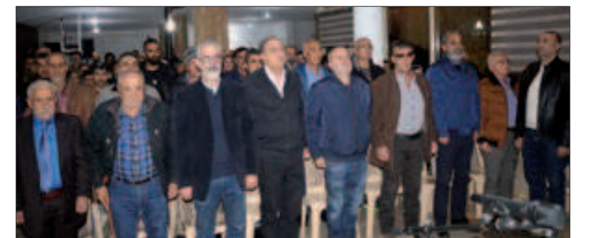
من احتفالات منفذية البقاع الغربي - مديرية سحمر