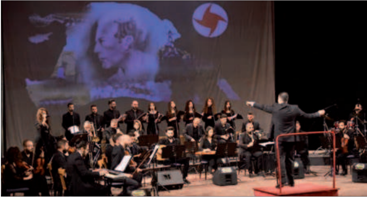
أمسية منفذية حمص