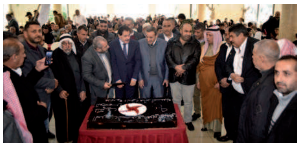
من احتفال مديرية وادي خالد