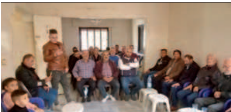
من احتفالات منفذية العاصي