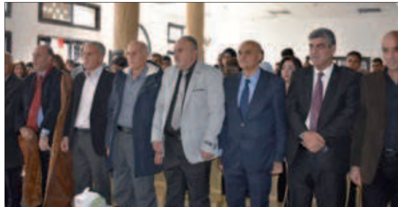
من احتفال منفذية حوران