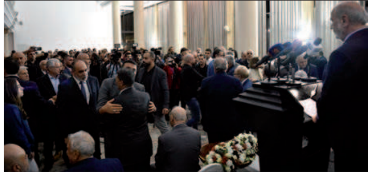
من حفل الاستقبال المركزي

رئيس الحزب الأمين أسعد حردان في حفل الاستقبال المركزي؛ لبنان عصي على التطوع ولن يستسلم لمشينة محاصريه، ومهما أغدق الخارج من أموال على وسائل التضليل ستبقى إرادة اللبنانيين أقوى وأصلب في الحفاظ على الوحدة وحماية السلم الأهلي البعض في مواقفه وسلوكه يستحضر مخطط التقسيم الذي رفضناه وحاربناه وأسقطناه ويحاول تمريره بعناوين، ظاهرها الإصلاح، وباطنها الإطاحة بالسلم الأهلي وإعادة الاقتتال خدمة لأعداء لبنان المطلوب ترسيم الثوابت والخيارات الوطنية وفق ما نصت عليه وثيقة الوفاق الوطني بتثبيت هوية لبنان وعلاقاته المميزة مع سورية وحقه المشروع في مقاومة العدوان وتحرير ما تبقى من أرض محتلة وثروات في البر والبحر الشام وقفت الى جانب لبنان ومقاومته ومع فلسطين ومقاومتها، وواجهت حرباً إرهابية كونية وانتصرت وهي تتعافى لتعود وتتصدر الدور عربياً وإقليمياً ودولياً