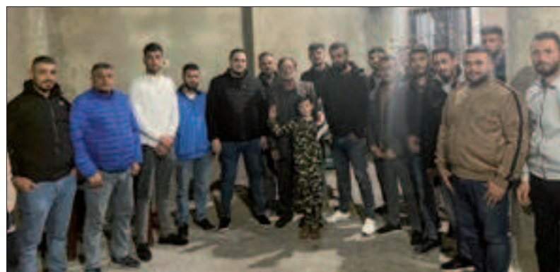
من احتفال منفذية الضنية