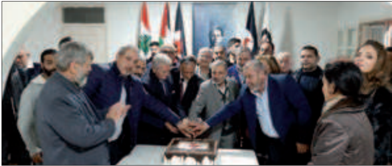
من احتفال منفذية بيروت

أحيت مديرية الميدان المستقلة عيد تأسيس الحزب، باقامت احتفالاً بالمناسبة تخللته كلمات وقطع قالب الحلوى.