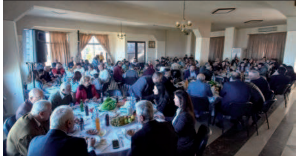
من حفل منفذية المتن الأعلى

أيها القوميون تماسكوا وتمسكوا بوحدة الفكر والنهج، التزموا بمؤسسات حزبكم، التي اعتبرها زعيمنا من أعظم إنجازاته بعد وضع العقيدة، فهي التعبير عن إخلاصكم لحزبكم وتفانيكم في سبيل انتصار القضية