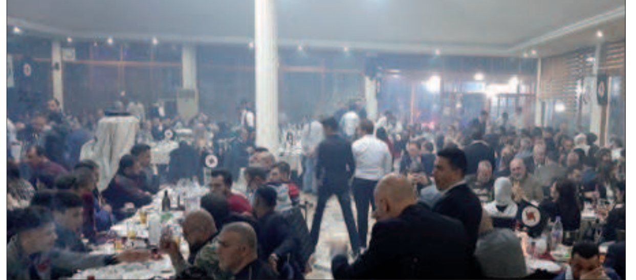
من حفل منغذية الغرب