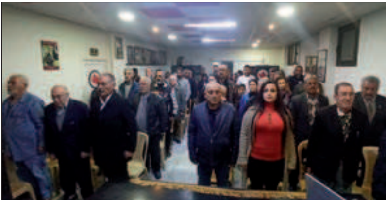
من احتفال منفذية سلمية