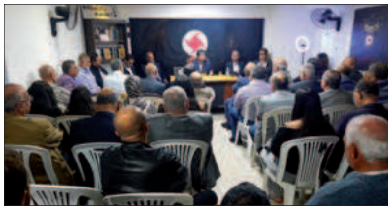
من ندوة منفذية صيدا - الزهراني - جزين