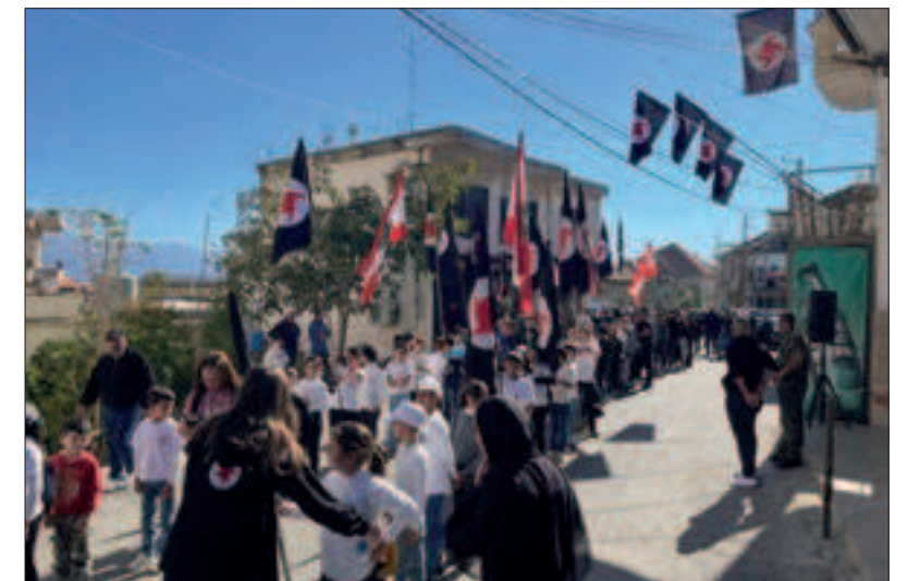
من مسيرة منفذية مرجعيون