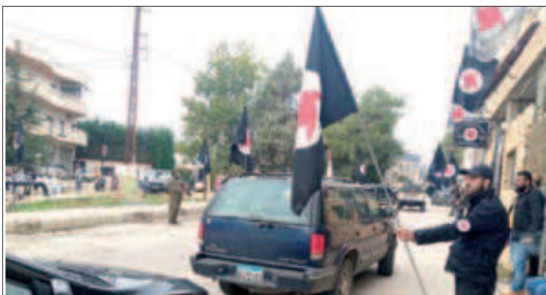
من احتفالات منفذية بعلبك - حاجز محبة في تمنين التحتا