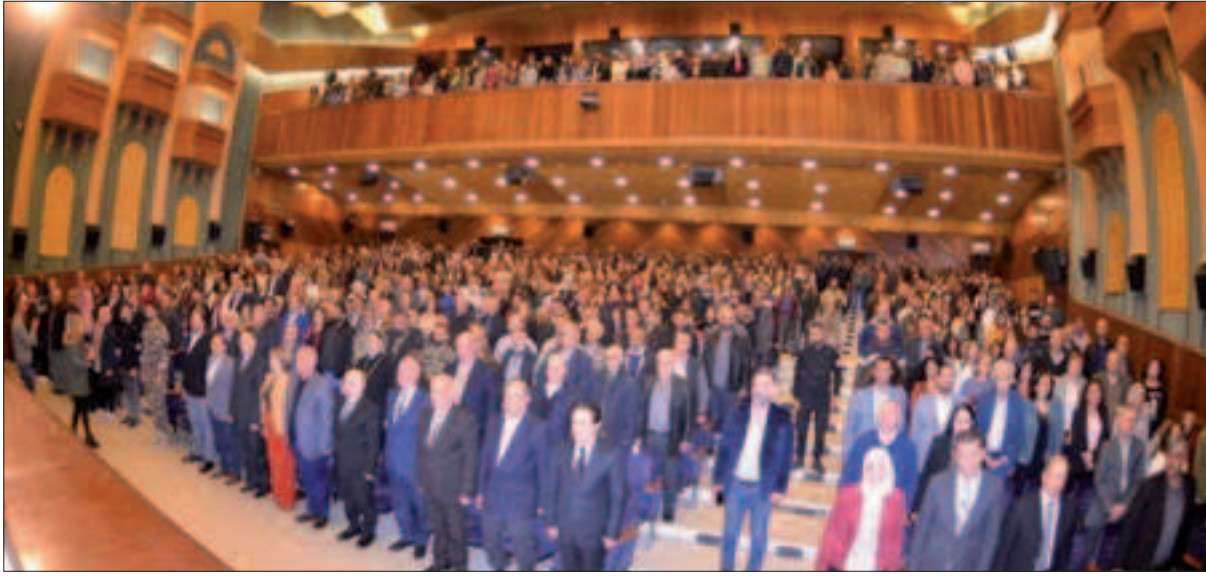
أمسية منغذية حمص