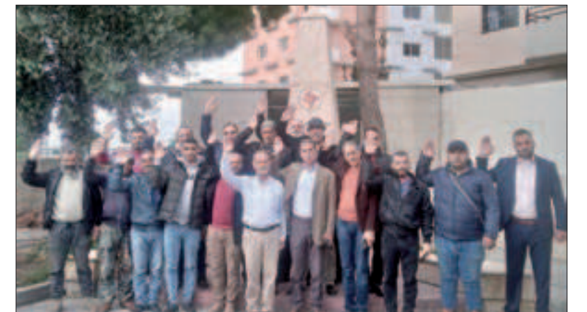
من احتفالات منفذية عكار.. وعد من المنتمين الجدد مع هيئة المنفذية