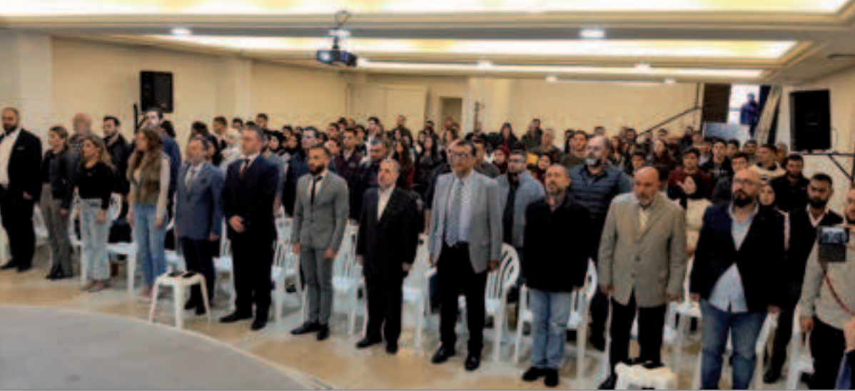
من احتفال منغذية الطلبة

أحيت منغذية صيدا - الزهراني - جزين عيد تأسيس الحزب فاقامت محاضرة في مكتبها ببلدة الغازية