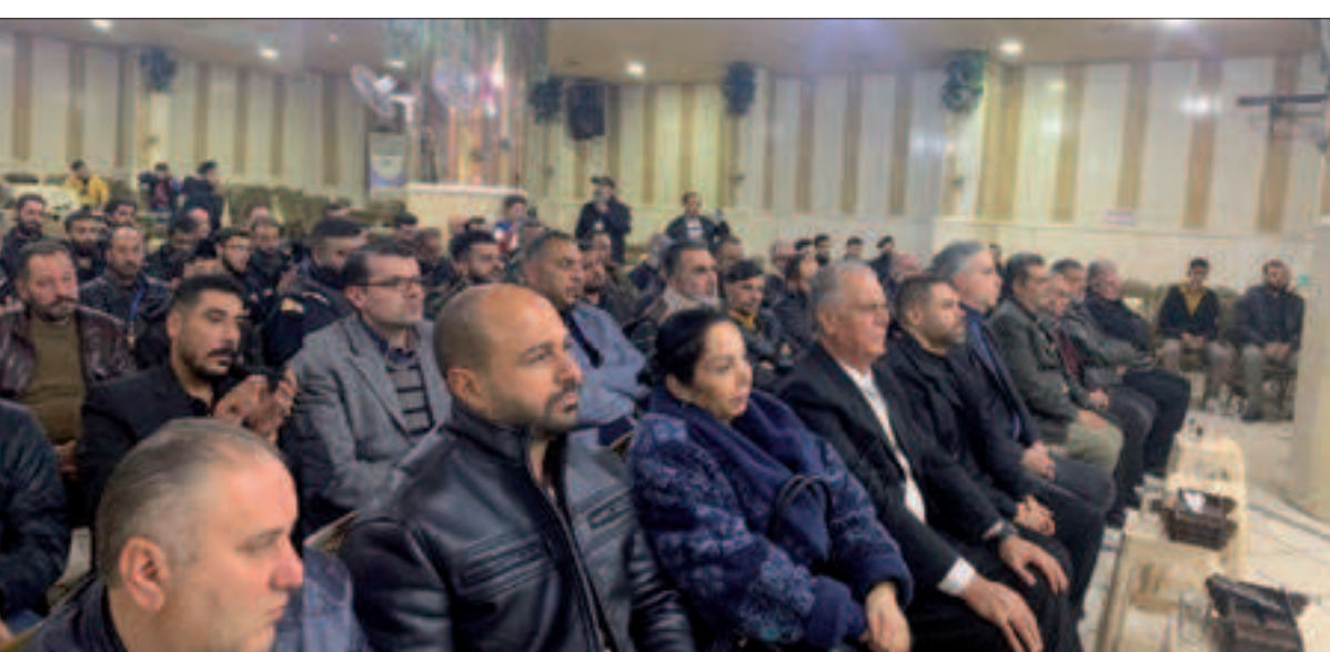
من احتفالات منغذية دمشق