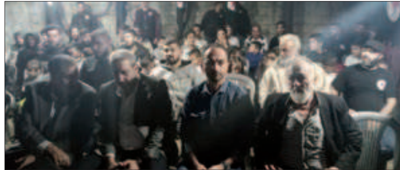
من احتفالات منفذية المتن الجنوبي - حفل افتتاح مكتب مديرية صحراء الشويفات