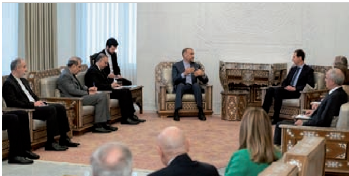
الرئيس الأسد مستقبلاً الوزير عبد الهيمان والوفد الإيراني في دمشق أمس