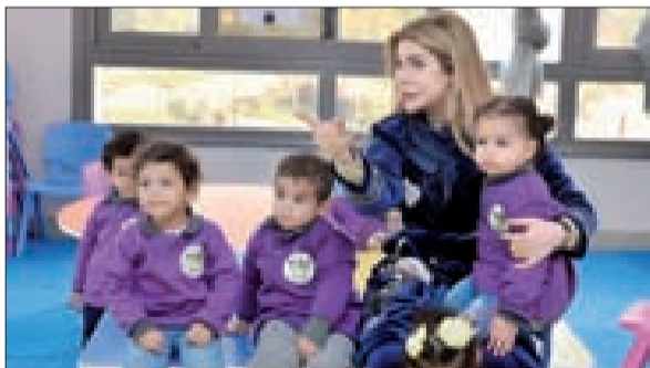
الكاتبة السهيل مع الأطفال في الحضانة