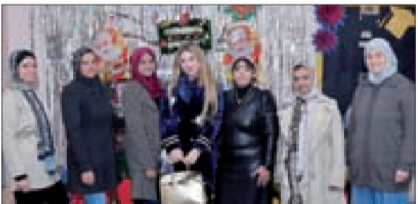
... ومع المديرية والمشرفات على الحضانة