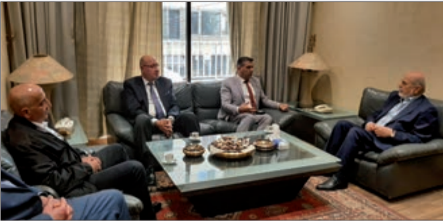
حردان مجتمعاً إلى وفد حركة التلاقي والتواصل

إلى ذلك، أشاد حرقوص بدور الحزب القومي وحرصه على وحدة لبنان واللبنانيين، وحيّا مؤسسها الزعيم انطون سعاده في ذكرى ميلاده.