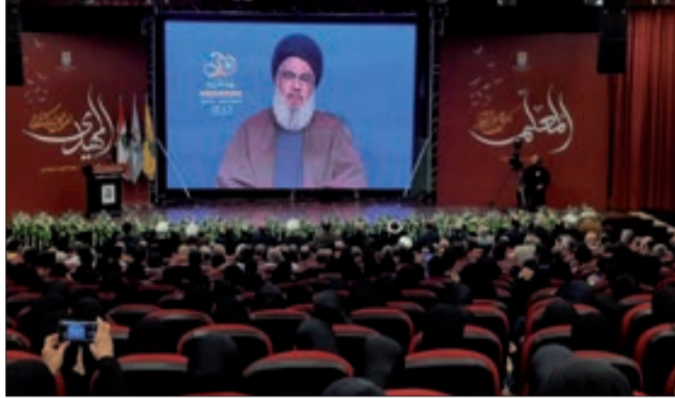
السيد نصرالله متحدثاً في احتفال مدارس المهدي أمس

وتابع «كل من يُهدّدنا بالقتل والحرب العسكرية والتجويح فهذا لا يُهدّدنا، ولو قتلتم نساءنا وأطفالنا ورجالنا لا يُمكن