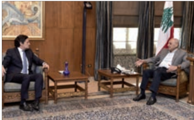
بري مستقبلاً المكاري في عين التينة أمس

عرض رئيس مجلس النواب نبيه بري في مقر الرئاسة الثانية في عين التينة مع النائب السابق غازي العريضي، الأوضاع العامة وآخر المستجدات السياسية. كذلك بحث بري مع وزير الإعلام في حكومة تصريف الأعمال زياد المكاري المستجدات وشؤوناً متصلة بوزارة الإعلام. ومن زوار الرئيس بري المطران بولس مطر.