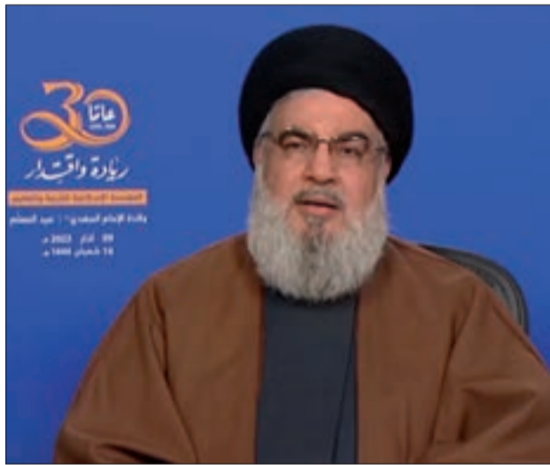
السيد نصرالله خلال إطلالته في احتفال مدارس المهدي أمس