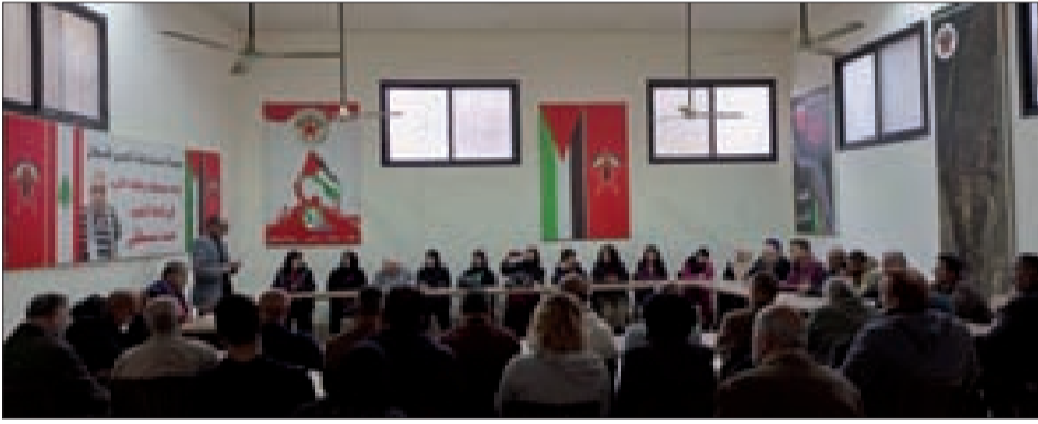
جانب من الحضور في الندوة