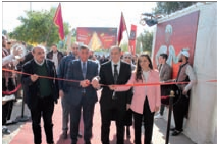
خلال قص شريط الافتتاح