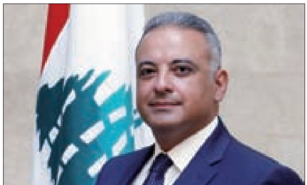
الوزير محمد وسام المرتضى

ردّ وزير الثقافة في حكومة تصريف الأعمال القاضي محمد وسام المرتضى على "بعض الأصوات التي دعت المسلمين إلى عدم التعتيل في مناسبات الأعياد المسيحية" وقال في بيان "يوم خرج الإمام الصدر مجاهداً ضدّ الحرمان ومنادياً بالعدالة الاجتماعية، لم ينظر إلى اللبنانيين بحسب قيّد النفوس الطائفي أو الهوية الدينية".