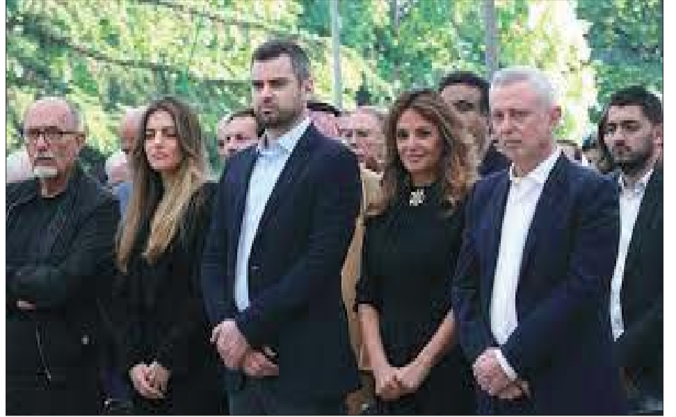
خلال إحياء ذكرى مجزرة إهدن أمس

وأضاف «كان المطلوب أن يتم تصويري بأني مرشح لفريق قبل أن يتم ترشيحي من رئيس مجلس النواب نبيه بري والأمين العام لحزب الله السيد حسن نصر الله» وقال «لم أخجل في يوم بانتمائي إلى مشروع سياسي ولكن عندما أصبح رئيساً ساكون لكل اللبنانيين لمن معي ولمن ضدي». وأشار إلى أنّ «الفريق الآخر لا تجمعه إلا السلبية والإلغاء وعندما تنتهي مصالحهم يعودون للصراع فيما بينهم».