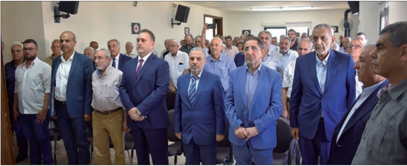
تغطية: عبيد حمدان

أحييت مديرية شمسطار التابعة لمنطقة بعلبك في الحزب السوري القومي الاجتماعي يوم الفداء - ذكرى استشهاد باعث النهضة أنطون سعاده في قاعة بلدية شمسطار التي غصت بفاعليات البلدة وأبنائها. وليس غريبا على شمسطار كل هذا الوفاء، وهي البلدة التي عرفت مفاهيم النهضة منذ البدايات وقدمت الكثير من التضحيات.. ولم تزل، أن تحيي يوم الفداء والوفاء. ذكرى استشهاد باعث النهضة أنطون سعاده، وهي بلدة الشهيد علي مصطفى الحاج حسن وكل من آمن بأن الحياة وقفة عز فقط. يوم أمس ارتفعت الزواجر في شمسطار على إيقاع «تحيا سورية» التحية التي رددناها منذ الصغر حتى قبل أن نعي كافة المفاهيم القومية الاجتماعية لكونها كانت حالة فطرية تنشأ في التكوين الروحي والعقلي لتلازم الوجدان المقاوم طالما الظلم قائما. حضر الاحتفال نائب رئيس الحزب وائل الحسينية على رأس وفد مركزي ضم عميد الدفاع علي عرار، عضو المجلس الأعلى د. جورج جريج، وكيل عميد الإذاعة شادي بركات، عضوي هيئة منح رتبة الأمانة فداء حمية وحسان عرار، إلى جانب منقذ عام بعلبك عباس محرز حمية والأمناء د. علي الحاج حسن، مصطفى مرتضى وعباس سماحة وبعض أعضاء هيئة التنفيذية ومسؤولي وعدد من مسؤولي الوحدات. كما حضر رئيس تكتل نواب بعلبك الهرمل الدكتور حسين الحاج حسن وعضو الهيئة الاستشارية في حركة أمل مصطفى السبلاني، مسؤول منطقة البقاع الأوسط في حزب البعث العربي الاشتراكي حسين سماحة، مسؤول الحزب الشيوعي اللبناني علي أسعد الطفيلي، رئيس بلدية شمسطار سهيل الحاج حسن، العميد المتقاعد حسين نهبنا، وفاعليات وأعضاء مجالس بلدية، وفد من رابطة مخاتير غربي بعلبك برئاسة المختار عبدالله شحيتلي وجمع من القوميين والمواطنين. استهل الاحتفال بالنشيد الوطني اللبناني ونشيد الحزب السوري القومي الاجتماعي.