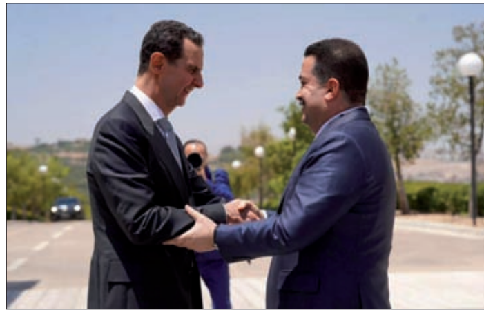
الأسد مرحباً بالسوداني في دمشق أمس

– للذين لم يتح لهم الاطلاع على ما قالته السفيرة الفرنسية آن غريو في احتفال قصر الصنوبر في ذكرى انتصار الثورة الفرنسية، نستعيد أبرز ما فيه، حيث قالت للبنانيين، أين كنتم اليوم لو أن فرنسا لم تحتضن، مع شركائها، قواكم الأمنية؟ لو أن قوات اليونيفيل، التي تضم 700 عسكري فرنسي لم تكن تؤمن الاستقرار في جنوب لبنان؟ وأين كنتم اليوم لو أن فرنسا لم تحشد جهود المجتمع الدولي ثلاث مرات متتالية لتجنّبكم انهياراً عنيفاً تحت وطأة الإفلاس المالي وتدهور الليرة والانفجار في مرفأ بيروت؟ وأين كنتم اليوم لو أن فرنسا لم تهب على وجه السرعة لدعم مدارسكم كي لا تغلق أبوابها، لا سيما المدارس الخاصة، والمسيحية منها بشكل خاص، التي تستقبل حوالي ثلثي التلاميذ اللبنانيين؟ أين كنتم اليوم لو لم تساهم فرنسا في تمويل عمل المستوصفات والمستشفيات وبرامج الأمن الغذائي كي يستمر اللبنانيون الذين يعانون من الأزمة بالحصول على رعاية صحية ذات جودة وتغذية صحيحة؟ أين كنتم اليوم لو أن الشركات الفرنسية قلصت أعمالها وتخلت عن فرق العمل المحلية فيها؟ لو أن بعض الشركات الفرنسية العالمية لم تراهن على لبنان لكي يكون لكم على الأقل مرفأً يستأنف نشاطه وإمكانية الحصول يوماً على موارد غازية؟ – اللبناني الذي لا تشعره هذه الكلمات بالإهانة عليه أن يعيد تفحص وطنيته، وأن يتساءل عن معنى الهوية الوطنية بين مفرداته، فلو كان ما تزعمه السفيرة الفرنسية من إنجازات فرنسية أبقّت لبنان واللبنانيين على قيد الحياة، لكان الكلام مهيناً ومذلاً، تقول الشعوب التي يقال لها، خذوا عطاءكم وارحلوا، فإن الكرامة الوطنية أغلى. (التمتة ص6)