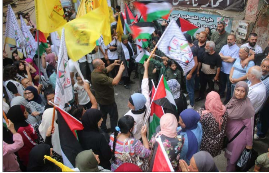
الوقف في شاتيلا