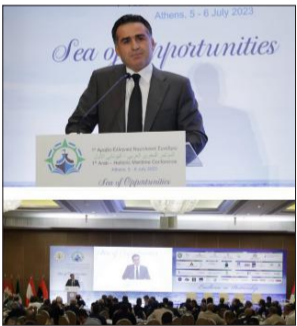
حمية مشاركاً في مؤتمر أثينا

أكد وزير الأشغال العامة والنقل في حكومة تصريف الأعمال علي حمية أن «التكامل التنموي بين شرق المتوسط وغربه في قطاع المرافئ والنقل البحري يفتح آفاقاً واعدة لتبادل الخبرات وفرص الاستثمار في قطاع النقل البحري، ولاسيما أن ضعف المتوسط تقعان في قلب كوربيدورات النقل العالمية»، معتبراً أن هذا الأمر «يفرض علينا أن تكون مرافئنا وموانئنا مؤهلة لتكون ممراً إلزامياً إليها ومنها على حد سواء».