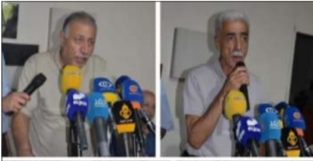
من اللقاء في برج البراجنة

واحد وهو تحرير فلسطين. وشدد مهدي على أن اتصالنا الوحيد مع العدو هو اتصال الحديد بالحديد، واتصال النار بالنار، معتبراً أن بهذا الإيمان ستبقى هذه الفصائل على عقل وقلب بندقية مقاوم واحد جميعها في طريق واحد لن ينتهي إلا بتحرير فلسطين.