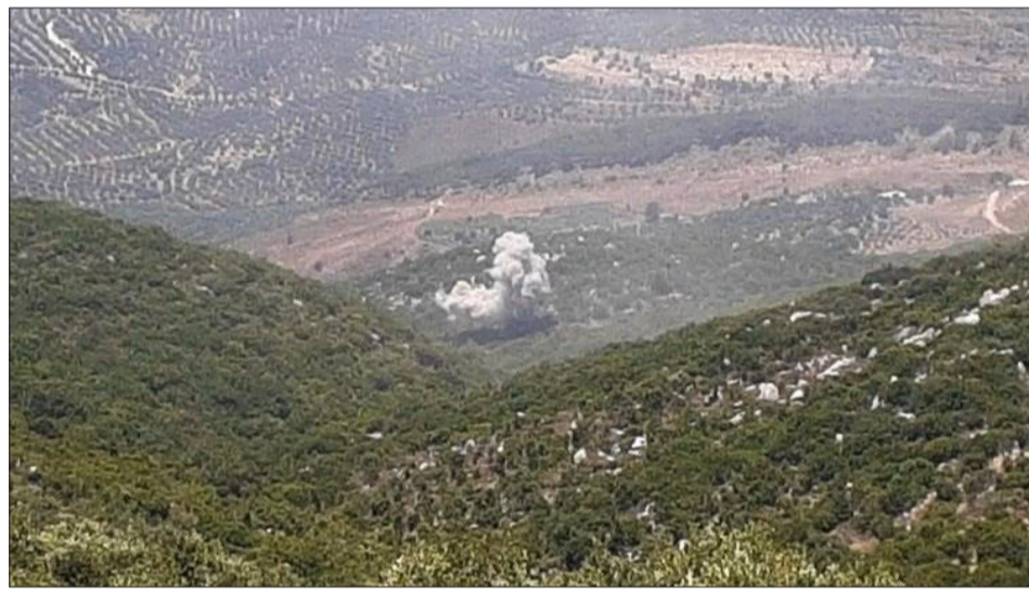
القصص الصهيوني لمنطقة خالية في محيط بلدة كفرشوبا أمس