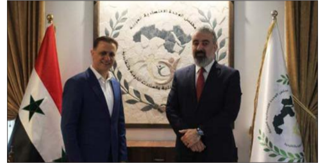
القدح والسفير الليبي خلال لقائهما في دمشق

استقبل رئيس الاتحاد العربي للأسر المنتجة والصناعات الحرفية والتقليدية، في مقر الاتحاد في دمشق، السفير الليبي في سورية محمد عبد الرزاق شعبان الذي أكد أهمية الجهود التي يبذلها الاتحاد في ما يخص تشجيع قطاع الصناعات الحرفية والتقليدية ودعمه وتمكين الأسر المنتجة على مستوى الدول العربية. كما أبدى شعبان «استعداد السفارة لتقديم ما يلزم لتسهيل أعمال المكتب الإقليمي في ليبيا»، معتبراً أن المشاريع التي يتم تنفيذها «تشكل عاملاً هاماً في استيعاب قوى عاملة وتحريك العجلة الاقتصادية للبلدان».