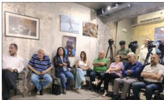
جانب من الحضور في الندوة