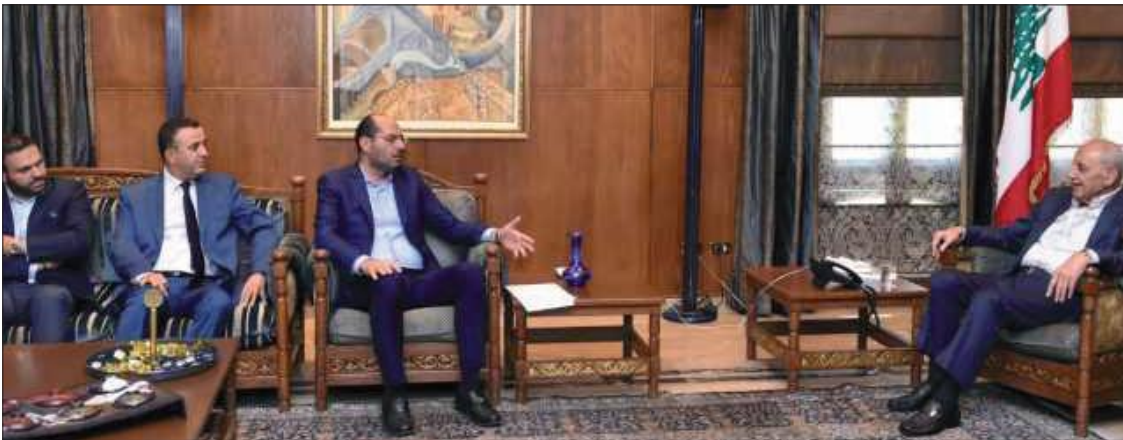
بري مستقبلاً مراد بحضور بيضون في عين التينة أمس

استقبل رئيس مجلس النواب نبيه بري في مقر الرئاسة الثانية في عين التينة، رئيس لجنة التربية والتعليم العالي النيابية النائب حسن مراد، في حضور عضو كتلة «التنمية والتحرير» النائب الدكتور أشرف بيضون، وجسرى البحث في شؤون تشريعية وقضايا تربية.