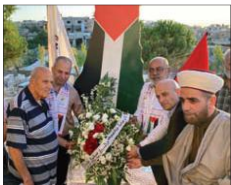
... ووضع إكليل من الزهر في بعلبك