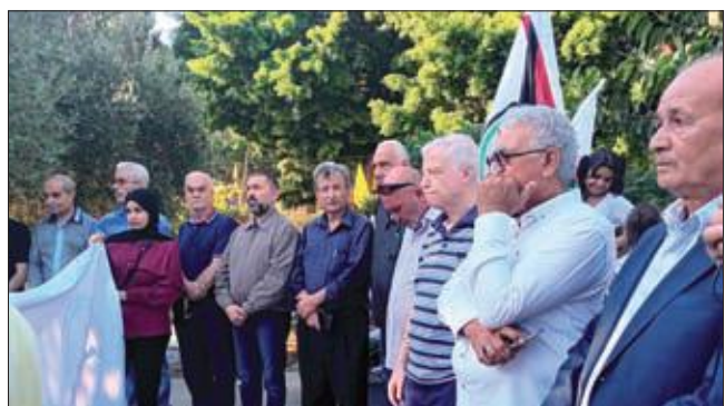
خلال زيارة مثوى الشهداء في شاتيليا

الثورة الفلسطينية إلى الوحدة خلف فلسطين وقضيتها لتحقيق آمال وتطلعات الشعب الفلسطيني. وحذر عزيز من تمادي العدوان الصهيوني بحق الشعب الفلسطيني، ومن اتساع دائرة الاستيطان التي تهدف إلى التغول في قضم الأراضي الفلسطينية لتحقيق الحلم الصهيوني في إقامة دولة الإحتلال المزعومة وهضم حق اللاجئين في العودة إلى أرضهم ومدنهم وقراهم.