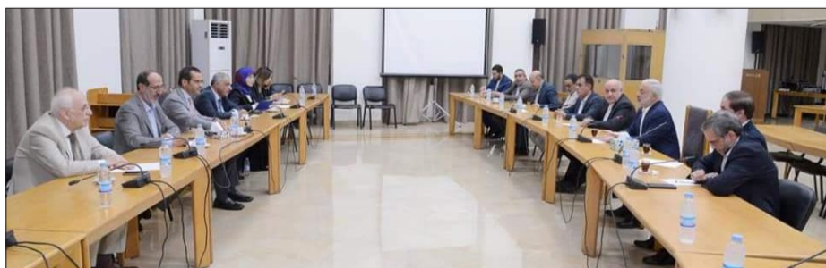
خلال اللقاء في مجلس النواب بين لجنة الشؤون الخارجية والوفد الإيراني

إلى التطلع إلى إرساء تقدّم في الملف النووي، والذي من شأنه المساهمة أكثر في فرض أجواء التهذبة في المنطقة». وشدّد على «السياسة التي ينفجها لبنان مع الدول العربية والإقليمية والغربية الصديقة، مع تأكيد تعزيز دور الديبلوماسية الاقتصادية في سبيل تطوير دعم اقتصاد وطننا وتشجيع الاستثمارات». كذلك شدّد الوفد الإيراني على «الوقوف الدائم بجانب لبنان دولة وشعباً». والتقى الوفد ممثلين عن القوى والفصائل الفلسطينية في مقرّ السفارة الإيرانية في بيروت، في حضور السفير الإيراني مجنبي أماني وأركان السفارة. وجرى خلال اللقاء عرض لآخر التطورات والمستجدات على الساحتين الفلسطينية والإسلامية.