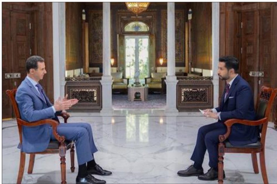
الرئيس الاسد متحدثاً خلال المقابلة مع قناة سكاى نيوز عربية

السوري الدكتور بشار الأسد لقناة سكاى نيوز عربية التي تتخذ من أبو ظبي مقراً لها، قال فيه إن سورية لا تتدخل في الشؤون اللبنانية، ولا تؤيد ولا تعارض مرشحاً معيناً للرئاسة. وعن المفاوضات مع الجانب الأميركي قال الأسد إن لا أمل يرتجى منها رغم امتدادها بصورة متقطعة لسنوات، لأن الأميركي يريد أن يأخذ دون أن يعطي، وقال الأسد إن لا جدوى من أي حديث عن فرضية تفاوض مع كيان الاحتلال، طالما أن الكيان غير جاهز لإعادة الأراضي المحتلة، مضيفاً أن سورية تجاوزت آثار عقوبات قانون قيصر، لكن العقبة التي تعترض عودة النازحين ونهضة الاقتصاد تتمثل بتدمير الإرهابيين للبنية التحتية، كاشفاً عن بحث مع الأمم المتحدة يتناول قضية عودة النازحين والشروط المطلوبة لضمان نجاح هذه العودة وفعاليتها، خصوصاً أن الذين عادوا وهم أقل من نصف مليون سوري نازح بقليل، شهادة على صحة التزام سورية بقوانين العفو، وفتح الطريق لطى صفحة الماضي، وطى صفحة الماضي هو ما كرره الأسد (التتمة ص 6)