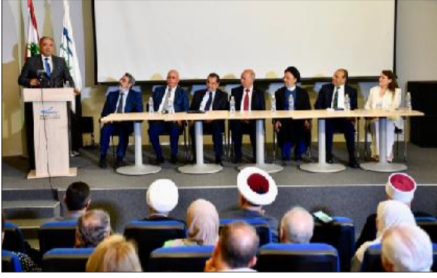
المرتضى يلقي كلمته