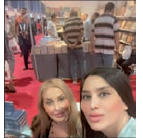
د. جرادي خلال مشاركتها في المعرض

تشارك الكاتبة والشاعرة اللبنانية الدكتورة زينة جرادي في معرض بغداد الدولي للكتاب في دورته الـ 24 الذي افتتحه رئيس الحكومة العراقية محمد شياع السوداني ووزير الثقافة د. أحمد فكاك البدراني في حضور وزراء ونواب وأدباء ومهتمين، وتشارك فيه عشرات دور النشر العربية والأجنبية ويستمر لغاية 27 أيلول الحالي. وتعرض عدد من دور النشر مؤلفات الدكتورة جرادي وهي: «سجينة بين قضبان الزمن» و«خرشيات امرأة» و«زينة الحكايات» و«أنا». وقد عبرت جرادي عن سعادتها لمشاركتها الدائمة في المعرض الذي يشكل كل سنة تظاهرة ثقافية إبداعية مميزة، ويخلق تفاعلاً ثقافياً مطلوباً وضرورياً باستمرار. وشكرت الحكومة ووزارة الثقافة العراقيتين على احتضان المعرض وتنظيمه وتسهيل أمور الناشرين والعارضين. وستوقع جرادي كتبها وتشارك في عدد من الندوات والنقاشات التي ستقام يومياً.