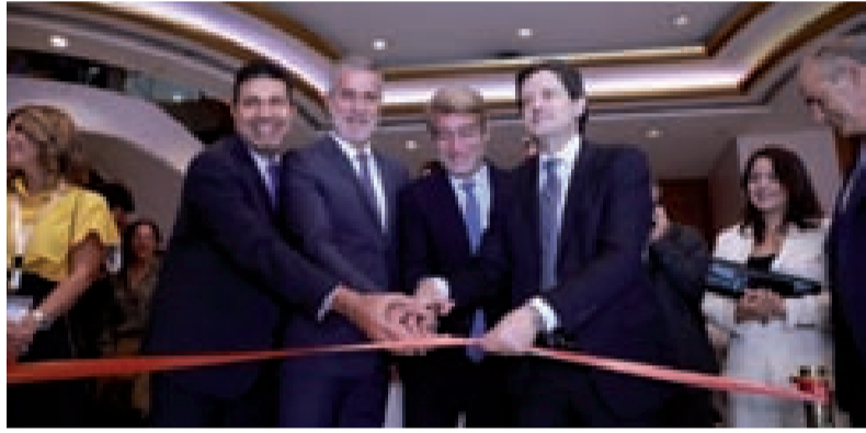
المكاري وفيّاض ونصار خلال افتتاح معرض أسبوع بيروت للطاقة

افتتح وزير الطاقة والمياه في حكومة تصريف الأعمال وليد فيّاض، بمشاركة وزير السياحة والإعلام في حكومة تصريف الأعمال وليد نصار ووزير المكاري، المعرض المرافق لـ«أسبوع بيروت للطاقة» في ضيعة، بحضور حشد من الاختصاصيين من لبنان والخارج.