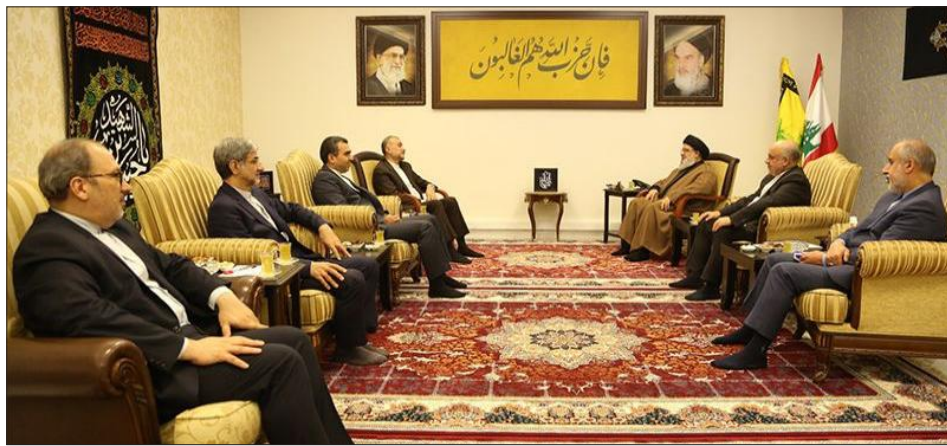
السيد نصرالله مستقبلاً الوزير عبد الهيان والوفد الدبلوماسي

أما عن العلاقات الإيرانية اللبنانية فقال عبد الهيان إنه جدد تأكيد العروض الإيرانية للمساعدة في قطاع الكهرباء بكل ما يحتاجه لبنان، بما في ذلك إقامة معامل بقوة 2000 ميغاواط. (التتمة ص 6)