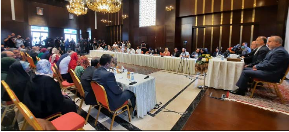
جانب من الحضور الإعلامي في المؤتمر

أكثر قوة واستعداداً وتأهباً من أي وقت مضى، وأنّ الكيان الصهيوني إذا قام بارتكاب حماقة باستهداف القادة الفلسطينيين، فإن المقاومة بإمكانها أن تُغيّر المعادلات».