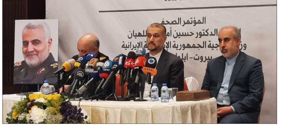
عبد الهيمان خلال مؤتمره الصحافي متوسطاً كتعاني وأمني

وكان عبد الهيمان التقى في اليوم الثاني من زيارته لبنان، رئيس مجلس النواب نبيه بري، وزير الخارجية عبد الله بو حبيب والأمين العام لحزب الله السيد حسن نصرالله، كما زار «روضة الشهداء» في الغبيري مع الوفد المرافق له، بحضور عضو كتلة الوفاء للمقاومة النائب أمين شري ورئيس بلدية الغبيري معن الخليل ووفد من عوائل الشهداء.