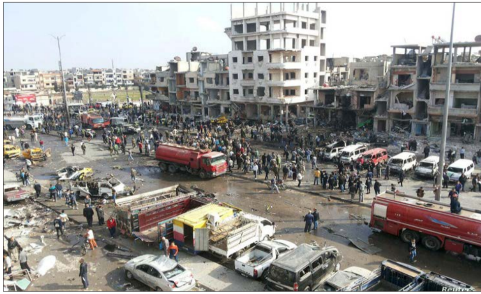
شهداء وجرحى وخراب نتيجة الهجوم الإرهابي على الكلية الحربية السورية في حمص

كان القصد جهات إرهابية تدعمها تركيا، لقال البيان جهات إقليمية وليس جهات دولية، وهذا يجعل أصابع الاتهام تتوجه نحو تنظيم قسد باعتباره الجهة الرئيسية المدعومة من الاحتلال الأمريكي، والأميركي هو الجهة الدولية، أي غير الإقليمية، التي تدير جماعات إرهابية في سورية عبر قواعدها. وإذا لم تكن قسد، فهذا يعني الجماعات المحسوبة تحت تسميات معارضة وتلقى دعماً أميركياً في قاعدة التنف.