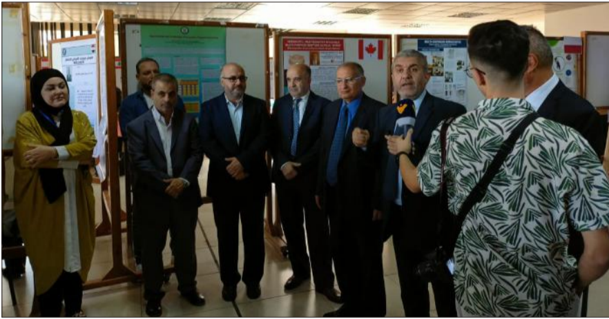
وزير العمل متحدّثاً خلال الافتتاح

مختلفة، بالإضافة لقسم بالشباب الفائزين في مباراة العلوم.