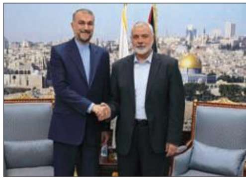
عبد الله وهنية

اعتبر وزير الخارجية الإيراني حسين أمير عبد الله "إسرائيل" والولايات المتحدة الأميركية "لم تكسبا شيئاً من الناحية العسكرية في ساحة المعركة، وستفشلان أيضاً في الساحة السياسية".