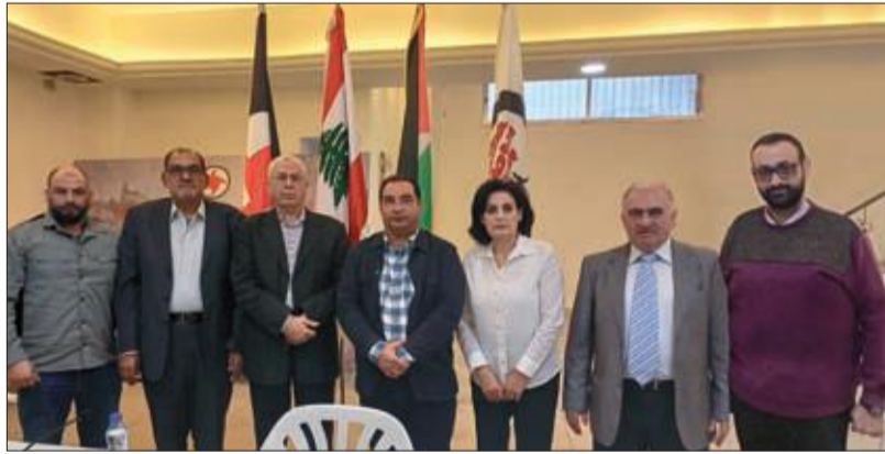
خلال اللقاء النقابي بين القومي وحماس

الاحتلال. الأهداف التي وضعها تنتهايو فشلت رغم الدعم الأميركي لهذا العدو الصهيوني. ورأى المجتمعون أن «طوفان الأقصى» رسم مسارا جديداً على طريق الصراع. وهذا المسار سيستمر حتى تحرير فلسطين وزوال