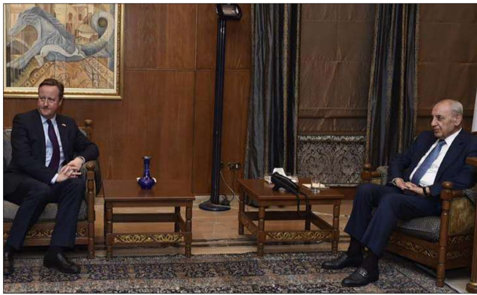
الرئيس بري مستقبلاً وزير الخارجية البريطاني في عين التينة أمس