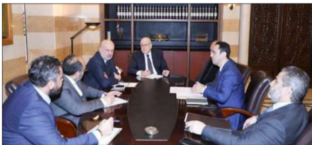
مبقتاتي مجتمعاً إلى مولوي وعبود في السرايا أمس

وقال أبو الحسن بعد اللقاء «زيارتي إلى الرئيس مبقتاتي كان لها الطابع الإنمائي وكان مطلب واضح للحكومة لتبادر إلى تطبيق القانون رقم 174/2020 الذي أجاز للحكومة البدء بالدراسات لإقامة وإنشاء أوتوستراد ونفق بيروت - البقاع. وكان النقاش في حضور رئيس مجلس الإنماء والإعمار نبيل الجسر، وأبدى الرئيس مبقتاتي كل تجاوب من حيث إطلاق الخطوة العملية الأولى للبدء بالدراسة، وكلف رئيس مجلس الإنماء والإعمار بإجراء التحضيرات اللازمة لهذا الأمر، وستكون هناك خطوات عملية تلي هذا التوجه، للمباشرة في تنفيذ هذه الدراسة».