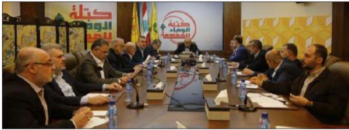
كتلة الوفاء للمقاومة برئاسة رعد

أكدت كتلة الوفاء للمقاومة أنّ «صورة الدمار الهائل في غزة، الإبادة الجماعية لأهلها، لا تستطيع أن تحجب واقع الفشل الذريع للعدو الصهيوني في تحقيق الأهداف التي أعلنها منذ بدء عدوانه البربري، وإخفاقه الواضح الذي تجلّى في عجزه عن إطلاق أسير صهيوني واحد بالقوة، وفي عدم قدرته على إنهاء حركة حماس أو النيل من قيادتها في غزة، فضلاً عن تورطه في مفاخرة خطر نشوب حرب إقليمية في المنطقة».