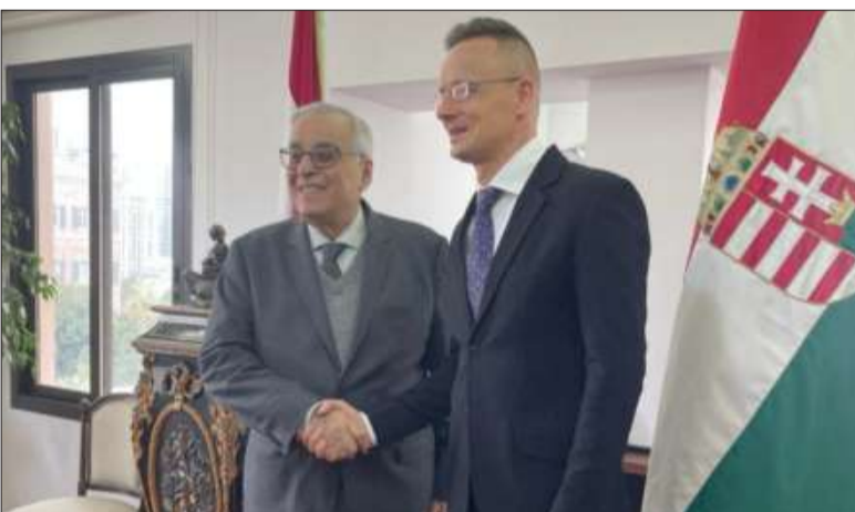
بو حبيب مرحباً ببنظيره الهنغاري أمس

ومن الخارجية، انتقل سيارتو والوفد المرافق إلى ميرنا الشالوحي حيث كان في استقباله رئيس «التيار الوطني الحر» النائب جبران باسيل.