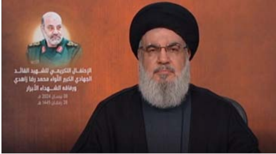
السيد نصرالله متحدثاً عبر الشاشة أمس