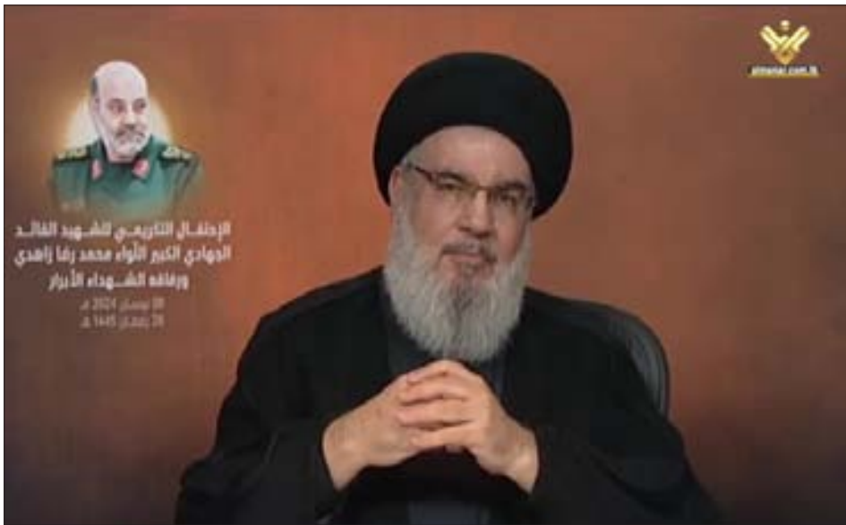
السيد نصرالله متحدثاً في الاحتفال التكريمي للقائد الشهيد اللواء محمد رضا زاهدي ورفاقه الشهداء

السيد حسن نصرالله عندما كان الخبر المؤكد يقول بالعثور على سليمان حيا، متوجها لحزب القوات اللبنانية وحزب الكتائب، بالتحذير من خطورة المغامرات التي تستسهل إشعال الفتنة في البلد، وتوجيه الاتهامات بلا سند، وبقي كلام نصرالله صالحا لجهة سقوط الاتهام الذي طال حزب الله رغم تأكيد مقتل سليمان.