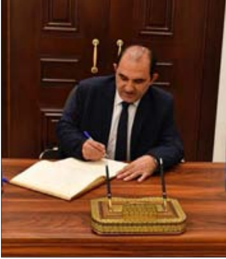
حمية يدون كلمة في سجل التعازي