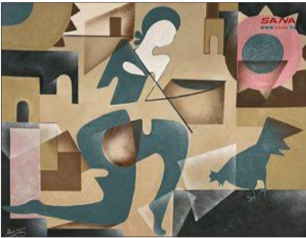
من لوحات نصر

مختزلة قوية وبسيطة وفق صياغة فنية تحمل شيئاً من الحدادة، وتحقق راحة للعين عند مشاهدة لوحاتها التي تتميز بقوة بنائها وتماسكها والجمع بين المعنى والتشكيل، كما تعكس فهمها للكتل وطريقة معالجتها للخطوط والمساحات والألوان بشكل جميل.