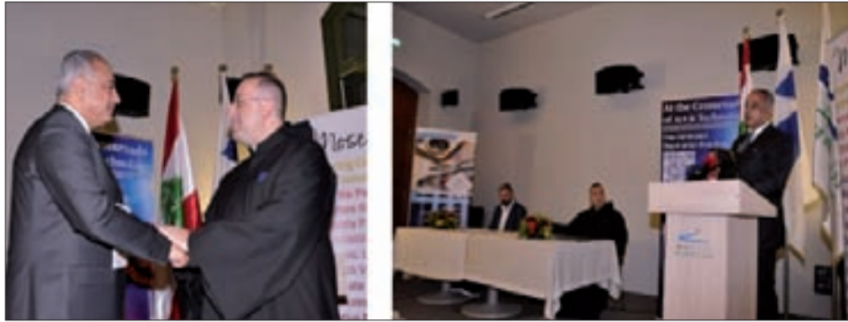
من المؤتمر الصحافي